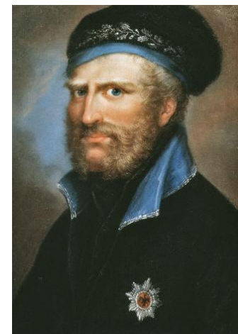
Abb. Links: Porträt Friedrich Wilhelms, genannt der Schwarze Herzog, aus dem Jahre 1809 von Johann Christian August Schwartz