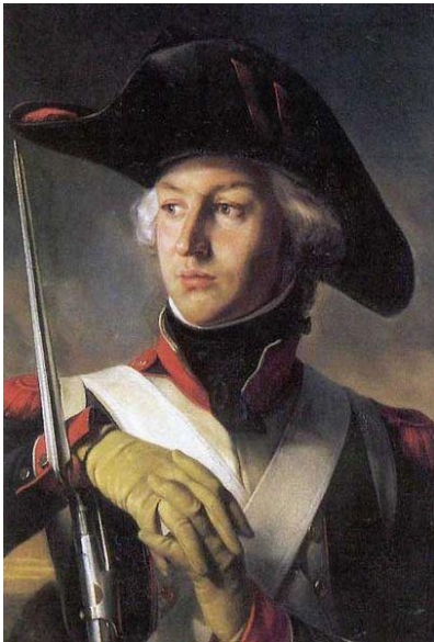
General Jean Andoche Junot

Das nach Bayreuth geschickte Korps befehligte Generalmajor Radivojevic. Am 1. Juni setzten sich 4196 Mann mit 213 Pferden und 4 dreipfündigen Kanonen Richtung Bayreuth in Bewegung. Am 11. Juni trafen sie in Bayreuth ein und besetzten die Stadt. Dabei erkundete die Kavallerie die Lage bis nach Bamberg und Nürnberg und ein Trupp rückte über Hof bis Gefell vor, „ohne jedoch etwas vom Feinde gewahr zu werden“. Radivojevic veröffentlichte eine Proklamation, in der er die Bayreuther Bevölkerung zum Widerstand gegen Napoleons Truppen ermutigte.