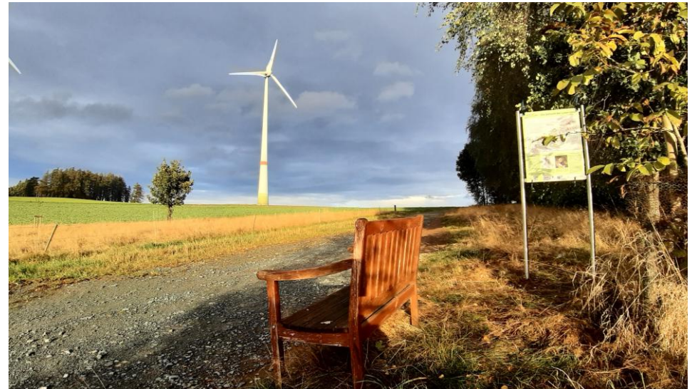
Infotafel auf dem Kesselberg, Foto: FGV Gefrees, 2025

Während in Napoleons Grande Armee auch Soldaten aus den Ländern des Rheinbundes dienten, scharten Österreich unter dessen Federführung „arbeitslose“ Soldaten aus preußischen Ländern zusammen. Der von Napoleon um sein Herzogtum gebrachte Friedrich Wilhelm von Braunschweig, im Bunde mit Österreich, sammelte eine kleine Freischar in Böhmen. Dieses Korps gab sich den Namen „schwarze Legion der Rache“. Seine Stärke betrug 2000 Mann