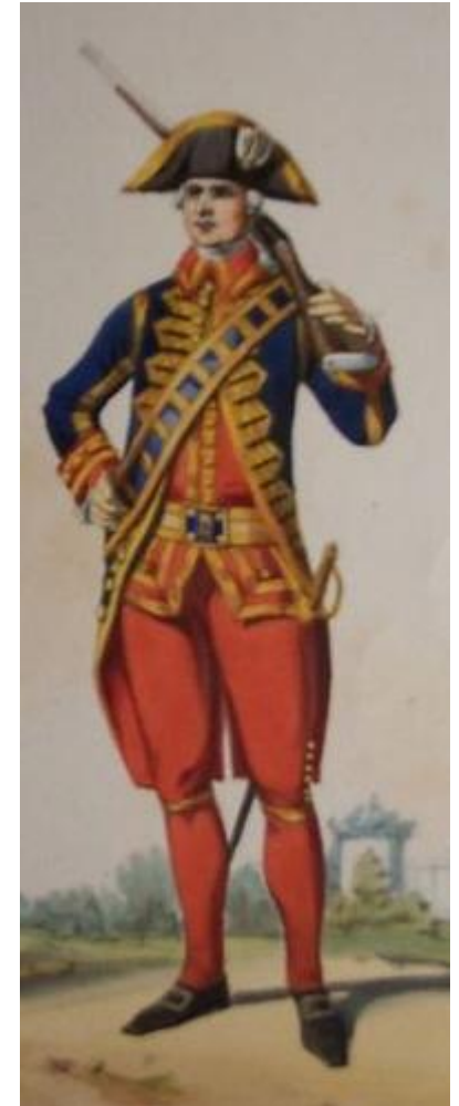
Abb.: Französischer Infanterist.

Die Nacht war inzwischen eingebrochen, und unter dem Schutze derselben zog sich der Feind mit Hinterlassung von 200 Schwerverwundeten eiligst über Bayreuth nach Creussen zurück.