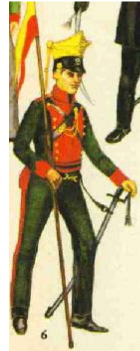
Abb.: Soldat der Braunschweigischen „Schwarzen Legion“

Wer heutzutage dem anmutig gelegenen Kurort Berneck entweder als Erholungsbedürftiger oder nur als gewöhnlicher Fußwanderer zustrebt, dem wird es, wenn er nicht gerade ein Forscher in der Spezialgeschichte der Gegend ist, wohl kaum bekannt sein, dass an dieser Stätte des Friedens und der Ruhe, der Erholung und des Naturgenusses einstmals wilder Kriegslärm und lautes Kampfgeschrei tobte und dass oberhalb und unterhalb des Städtchens zu Napoleons Zeiten ein nicht unbedeutendes Gefecht und zwar, was damals viel aufwog, zu Gunsten der deutschen Waffen stattfand. Es ist freilich etwas lange her, 90 Jahre, aber immerhin ist diese denkwürdige Tatsache bei der Bevölkerung des Ortes wie der Umgegend nicht in Vergessenheit geraten, ja sie wird manchmal kräftig wieder aufgefrischt durch Funde, die der Landmann beim Pflügen und Bearbeiten seiner Felder macht und die ihn nur zu lebhaft an die bösen Zeiten der französischen Herrschaft erinnern.