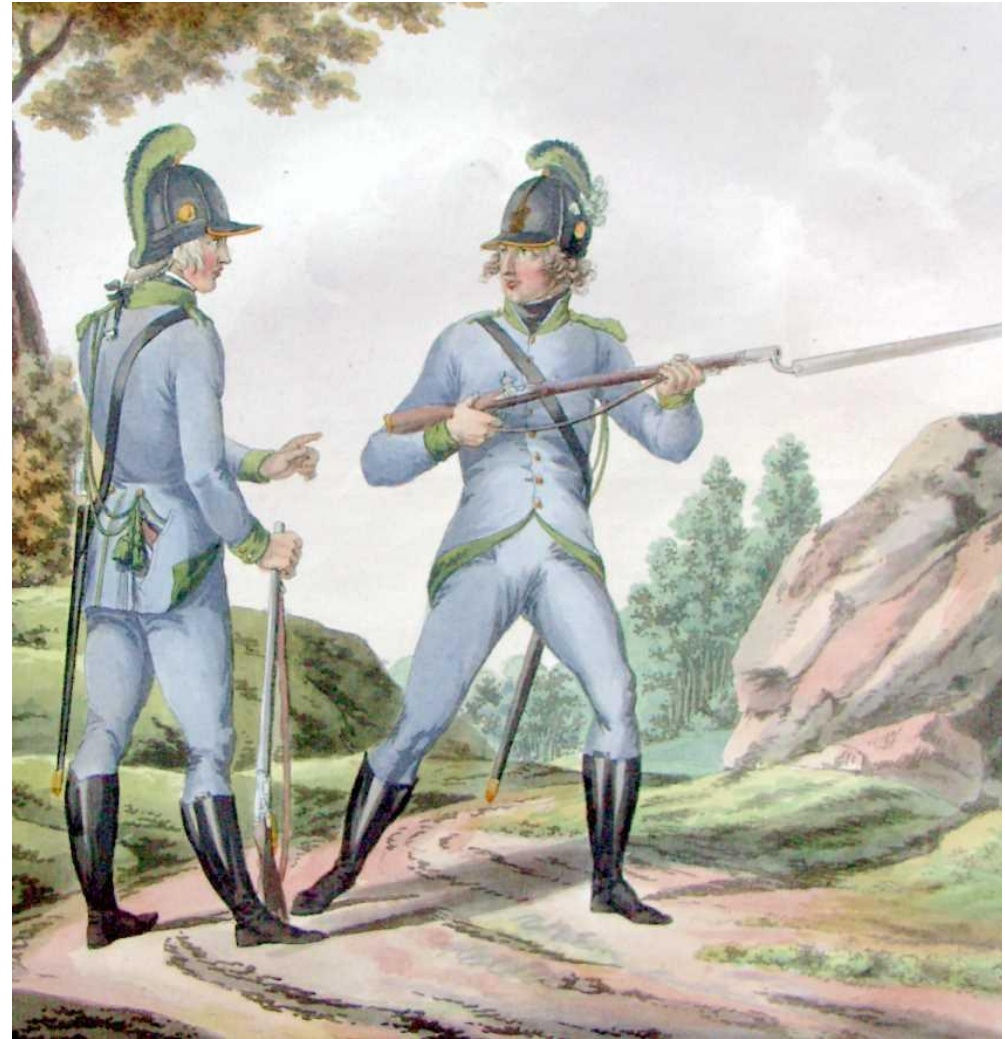
Abb.: Österreichische Soldaten