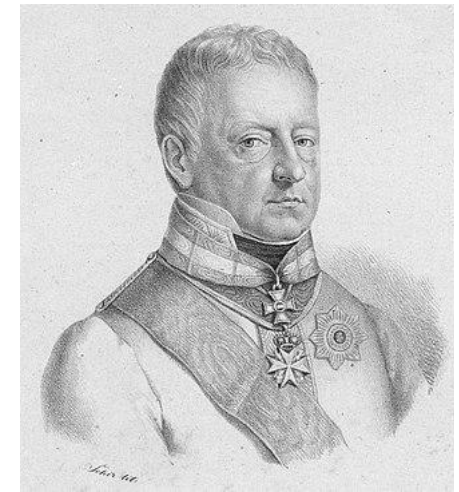
General Michael von Kienmayer