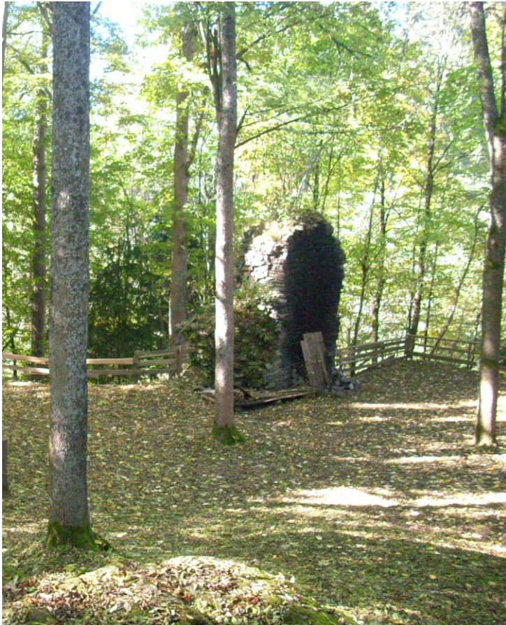
Foto: Das übrig gebliebenen Mauerstück der Grünsteiner Burg (Markus Thoma, 2010)

Wanderer, die auf dem Westweg W vom Rastplatz am Tennishaus ins Ölschnitztal starten, können in der laubfreien Jahreszeit kurz vor der Grünsteiner Mühle den kleinen Mauerrest der