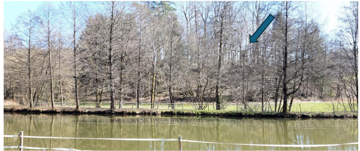
Foto: Burghügel mit dem Mauerrest der Ruine Grünstein

Burgruine Grünstein entdecken. Nach der Mühle zeigt ein Wegweiser auf den kurzen Weg hinauf zum Ruinengelände, das auf einem Felssporn liegt, der vom Lübnitzbach umflossen wird.