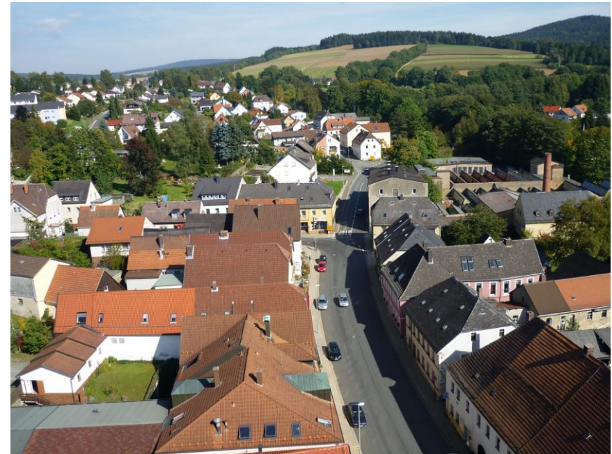
Blick aus dem Kirchturm zum Galgenberg.

Die sogenannten Richtstätten wurden strategisch an gut sichtbaren Anhöhen außerhalb der Stadt und entlang von Straßen platziert, um eine abschreckende Wirkung zu erzielen. Durch den Bau