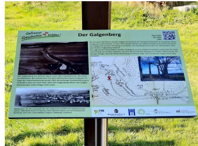
Die Wandertafel für den Galgenberg, Foto: FGV Gefrees, 2025

Bis vor etwa 250 Jahren waren Galgen an zahlreichen markanten Orten im ganzen Land errichtet, als ein deutlich sichtbares Symbol der Hochgerichtsbarkeit. Man unterschied zwischen der hohen und der niederen Gerichtsbarkeit. Letztere befasste sich mit kleineren Vergehen und zivilrechtlichen Angelegenheiten, wobei sie Strafen wie Geldbußen oder Haft verhängte und in der Regel unter der Autorität des lokalen Grundherrn stand. Im Gegensatz dazu beurteilte das Hoch- oder Halsgericht schwerwiegende Kapitalverbrechen wie Mord, schweren Raub, Brandstiftung oder Vergewaltigung.