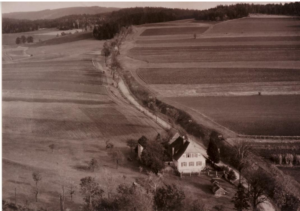
Die alte Landstraße über den Galgenberg Quelle: HF Gefrees, Aufnahme ca. 9040

eines Galgens wurde verdeutlicht, dass hier Recht und Gesetz oberste Priorität haben. Während des 30-jährigen Krieges von 1618 bis 1648 fand vermutlich die letzte Hinrichtung am Gefreerer Galgen statt. 1672 beantragte die Bürgerschaft den Neubau des Galgens, der damals baufällig war. Dieses Symbol für Recht und Gesetz war für die Menschen damals wichtig und das wollte man nicht aufgeben.