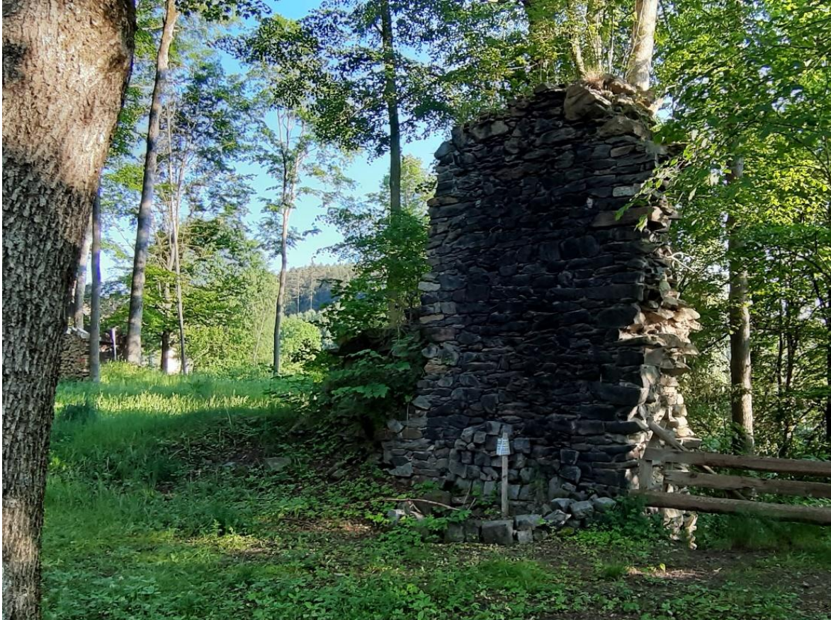
Die Mauerreste der ehemaligen Burg in Grünstein

rund 300 Jahren. Die Wallenrodener, Vasallen der Nürnberger Burggrafen, gaben die Anlage auf. Der Zahn der Zeit und der Fleiß der Grünsteiner sorgten für das Verschwinden der Gebäude und Burgmauern. Die Grünsteiner Feuerwehr nutzte bis vor einigen Jahren einmal im Jahr die Grundstücke für ein wildromantisches Burgfest. Am Mauerrest loderte ein stattliches Kaminfeuer und sorgte für Wärme und Mückenschutz, was den Besuchern guttat, dem Rest der Mauer aber nicht!