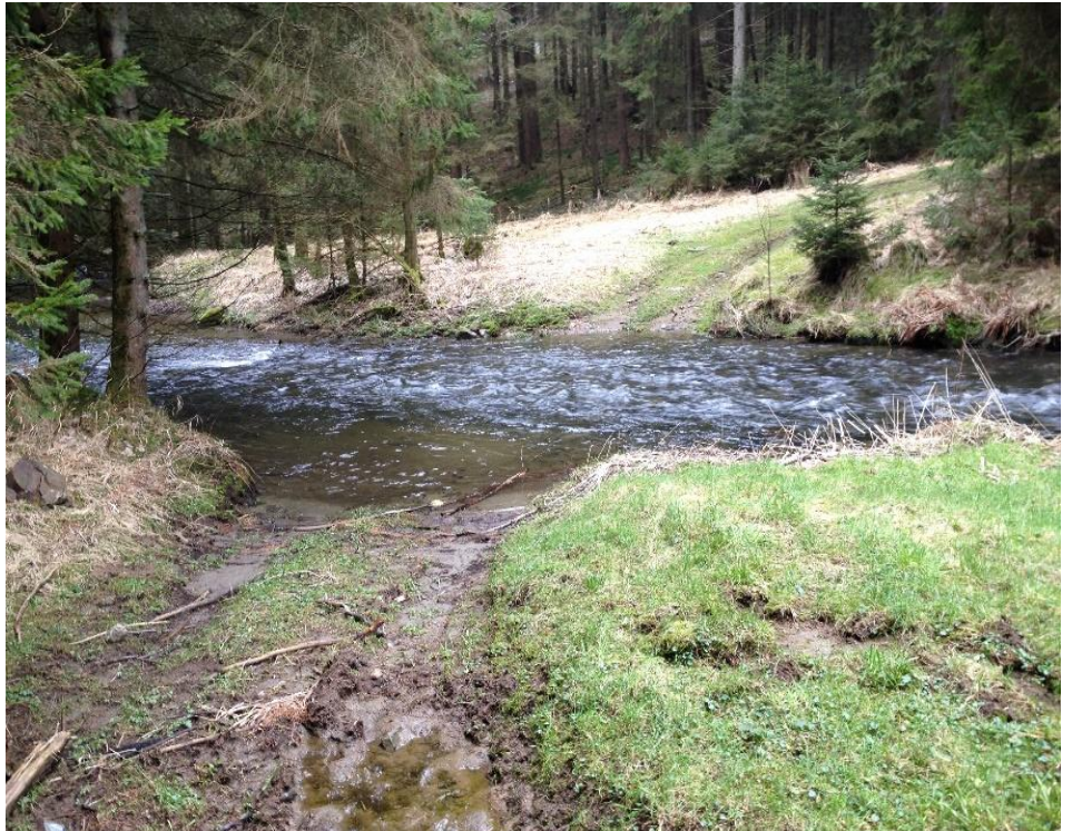
Furt durch die Ölschnitz

Das idyllische Ölschnitztal weist heute noch sichtbare Spuren auf, die vom Bergbau im Fichtelgebirge Zeugnis ablegen. Am Westrand des Fichtelgebirges gab es zahlreiche Bodenschätze: Zinn, Kupfer, Eisenerz, wertvolle „Erden“ wie Gold, Glimmer, Feldspat, Alaun und Speckstein. Unglücklicherweise schlummerten diese Stoffe nicht in Reinform in der Erde, sondern immer in Verbindung mit Gesteinen oder Sanden. Das Bachwasser lieferte die Kraft, um mit schweren Hammerwerken das Gestein zu zerkleinern, Holzkohle aus den Wäldern lieferte so viel Hitze, um Erze auszuschmelzen. Im Ölschnitztal finden sich an den Steilufern zwischen Schartümpel und Entenmühle zahlreiche tiefe, noch heute gut sichtbare Rinnen, die von Ochsenge-spannen stammen, die entweder mit geschlagenem Holz oder Holzkohle beladen zur Furt an der Ölschnitz führen. Die Hinterräder der beladenen Karren wurden mit massiven Holzstämmen blockiert, bevor man auf „Talfahrt“ ging. So entstanden die tiefen Furchen in den Talhängen. Die Holzkohle aus den Metzlersreuther Wäldern wurden z.B. nach Marktschorgast und ins Kosertal gebracht, wo das Eisenerz abgebaut und dann geschmolzen wurde.