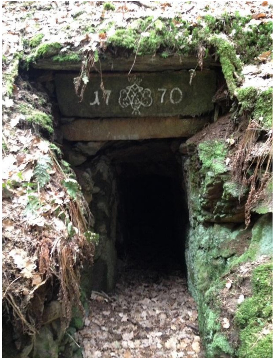
Tunnelbau im Uferbereich der Ölschnitz

Es könnte sein, dass das umgeleitete Wasser in dieser Zeit die Zufahrt zu der Furt so stark ausgespült hatte, dass die Fuhrwerke die Furt nicht mehr erreichen konnten. Möglicherweise war dies der Grund, die Rückleitung des Ölschnitzwassers unterirdisch durch den Tunnel vorzunehmen.