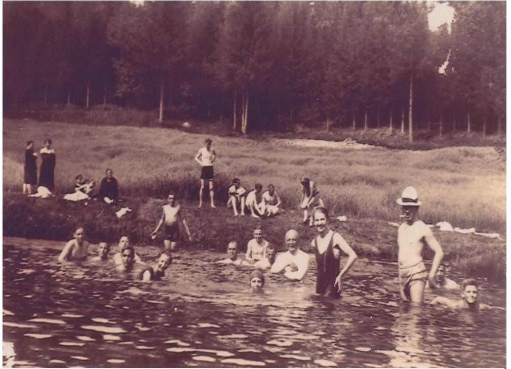
Badevergnügen 1914

Es ist das Mündungsgebiet der Bäche Ölschnitz und Lübnitz, die bei der Vereinigung um die Vorfahrt ihrer Wassermassen kämpfen. Bei der Einmündung prallen sie mit voller Wucht aufeinander! Und das hat Folgen: Das Wasser staut sich, der Wasserspiegel wächst, ein Strudel entsteht: siegt der Lübnitzbach, geht es links herum, schafft es die Ölschnitz, geht es rechts herum. Im Strudelzentrum sammelt sich Sand