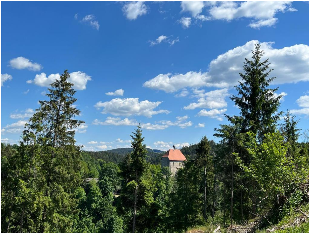
Burgkapelle Stein

Die Burgkapelle Stein grüßt majestätisch herab von einem hohen Felsporn, der von der Ölschnitz umspült wird. Als letztes größeres Überbleibsel der fast 700-jährigen Burganlage überdauerte das Haupthaus, das im 13. und 14. Jahrhundert die dreigeschossige Kemenate beherbergte. Im 30-jährigen