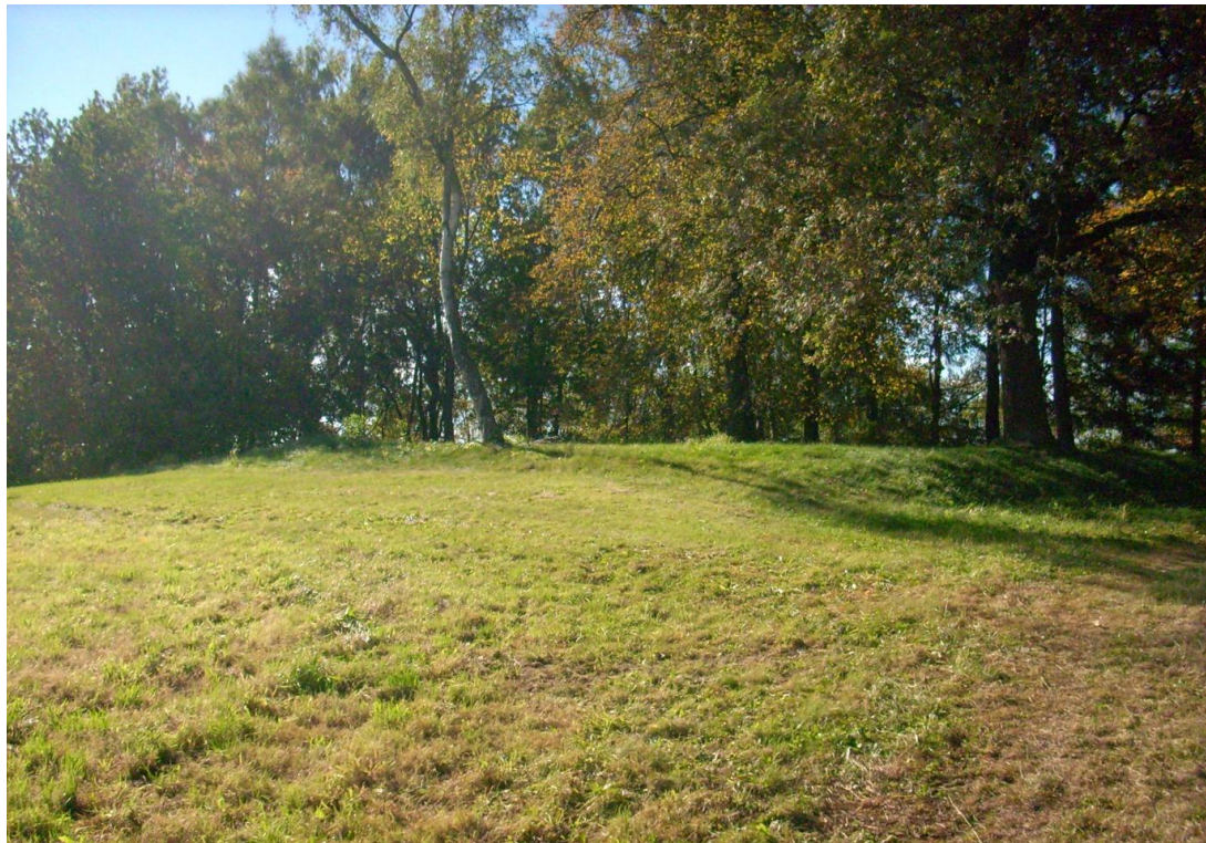
Der Burgstall Wallberg.

Auf der Spornkuppe des Wallberges, der nach Südosten über Streitau vorspringt, sind die Überreste einer mittelalterlichen Kleinburg zu finden. Die Nordseite war einst durch einen Abschnittswall mit vorgelagertem Graben gesichert. Die Abschnittsbefestigung, die geradlinig von Westen nach Osten verläuft, ist stark