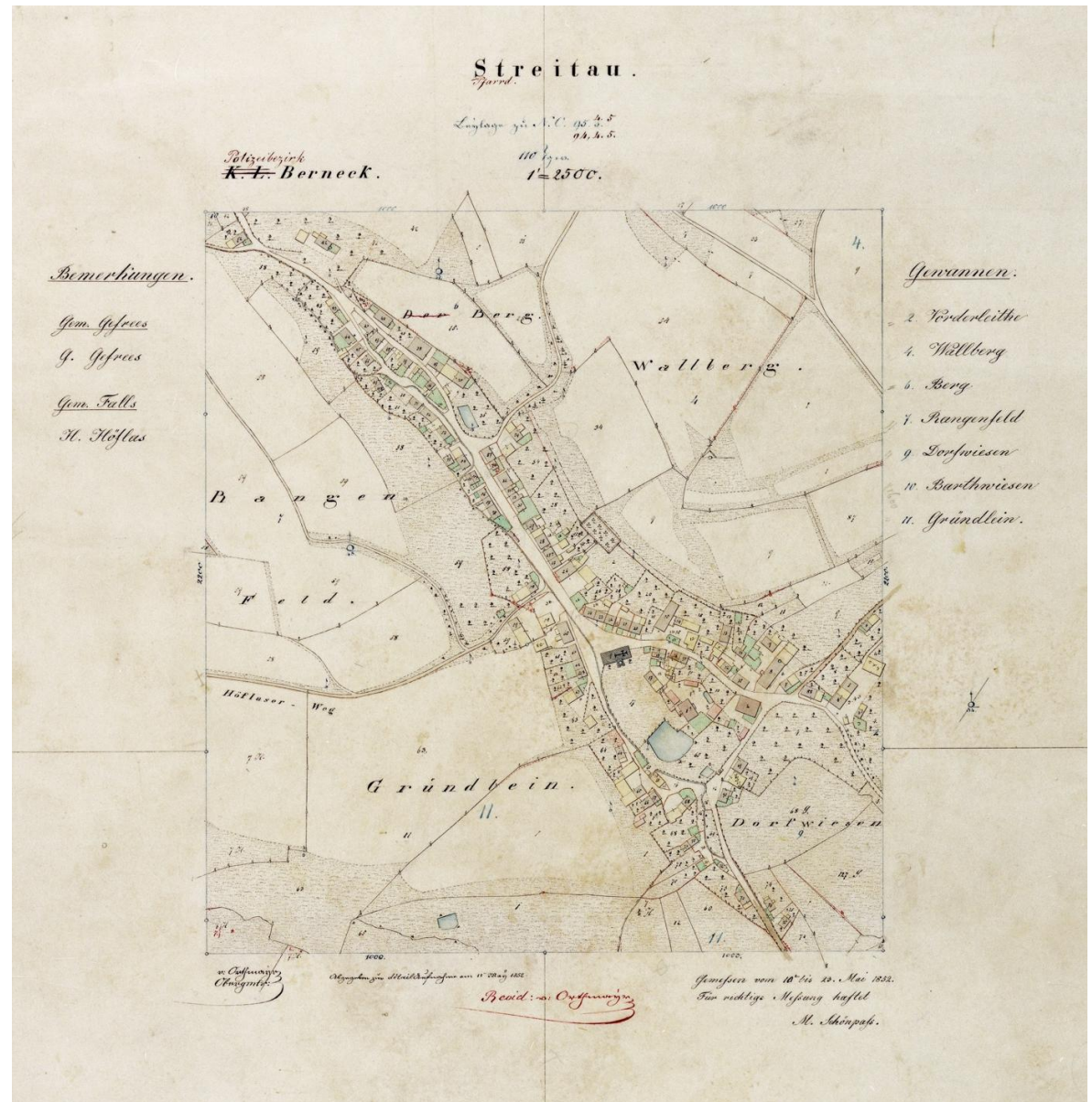
Streitau 1852.

Durch die Gebietsreform am 1. Juli 1972 kam Streitau zusammen mit Gefrees zum Landkreis Bayreuth. Wenig später wurde Streitau ein Ortsteil von Gefrees.