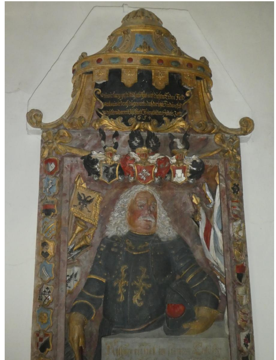
Grabstein des Wilhelm Heinrich von Waldenroth (1654 – 1725) in der St.-Georgs-Kirche in Streitau, Foto: FGV Gefrees, 2025

Das ehemalige Rittergut Streitau taucht erstmals in schriftlichen Quellen aus der Mitte des 14. Jahrhunderts auf. Um 1350 errichteten die Wallenrode die „veste Streitaw“, die in einem Bamberger Burghutverzeichnis verzeichnet wurde. Dadurch entstand die Linie der „Wallenrod zu Streitau“. Diese Urkunde markiert gleichzeitig die Ersterwähnung von Streitau. Ab 1363 wird Streitau als Rittersitz erwähnt. Die Wallenrod zu Streitau gerieten ab 1509 in die Lehensabhängigkeit der Hohenzollern. Zu Beginn des 15. Jahrhunderts erreichte das Geschlecht der von Wallenrod seinen Höhepunkt. Die fränkische Linie derer von Wallenrod erlosch 1739.