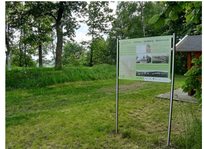
Infotafel auf dem Wallberg, Foto: FGV Gefrees, 2024

gestört, da der Wall größtenteils abgetragen und der ursprünglich 15 Meter breite Graben verfüllt wurde.