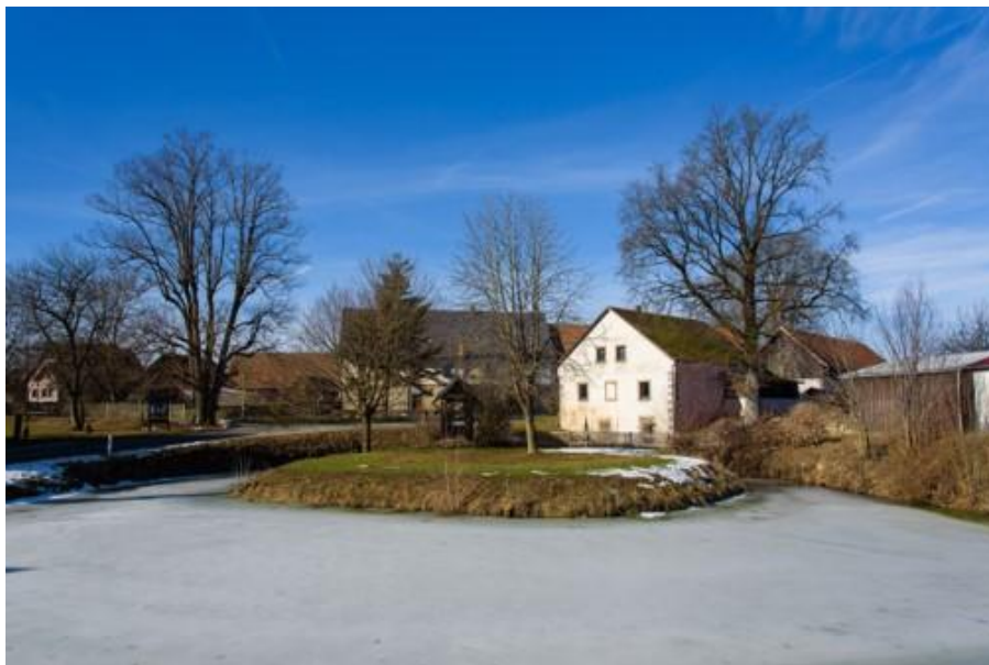
Foto: Winterbild der ehemaligen Turmhügelanlage, Florian Fraaß, 2019

Tatsächlich zeugt die Anlage von einem mittelalterlichen Turmhügel. Von der von einem wassergefüllten Graben umgebenen Mottenanlage ist noch der mittelalterliche Turmhügel erhalten. Im Nordwesten ist der Graben durch eine Einfüllung verschmälert.