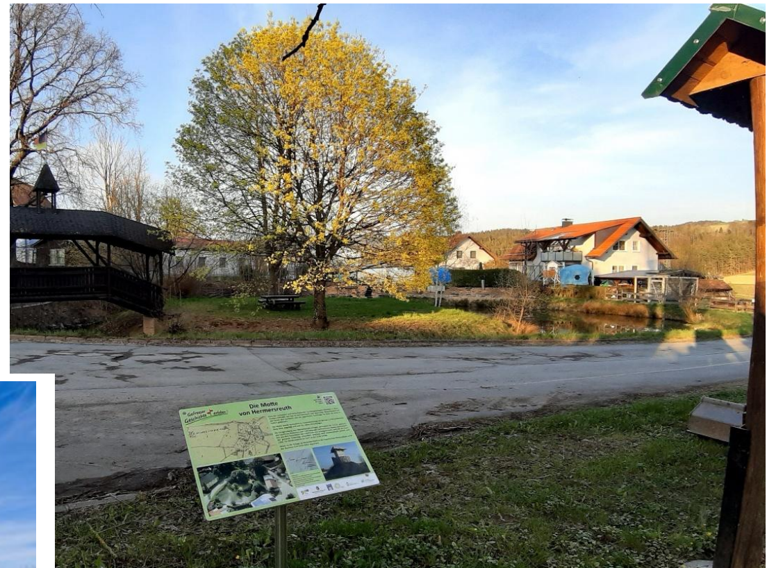
Infotafel der Motte in Hermersreuth

Die Walpoten, die mit der Vertretung des Grafenamtes im Radenzgau beauftragt waren, waren die Vorfahren der zu dieser Zeit in Stein ansässigen Edelfreien zu Stein und Scoregast (das heutige Marktschorgast). So dürfte die Anlage in Hermersreuth im engen Zusammenhang mit der Burg in Stein stehen. Im Umfeld großer