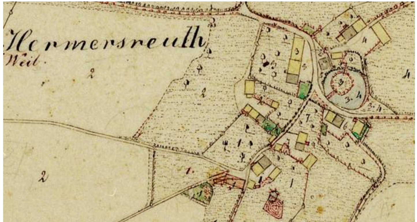
Uraufnahme von 1852 (Bayerische Landesvermessung)

Infolge der Expansion der Nürnberger Burggrafen in das Münchberger Gebiet, verlor die Turmhügelanlage in Hermersreuth ihre strategische Bedeutung. Das Ende der Anlage könnte auf das Jahr 1430 datiert sein, weil sie vermutlich durch den Hussiteneinfall 1430 zerstört wurde.