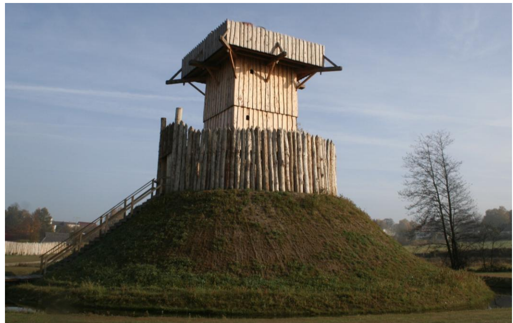
Rekonstruierte Motte im Geschichtspark Bärnau

Der Außenwall war meist mit Palisaden bewehrt und der Zwischenraum zwischen Erdhügel und Außenwall wurde oft mit Wasser geflutet. So entstand eine kleine einfache