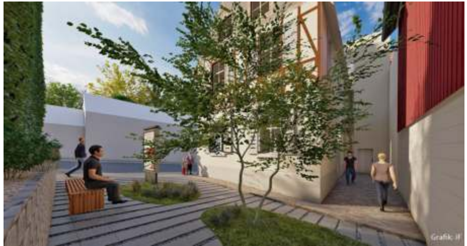
Situation im Innenhof, Blick von Norden

Erste Gespräche mit dem Gesangsverein, dem Historischen Forum, dem TV Gefrees, dem Volkstanz- und Trachtenverein, der