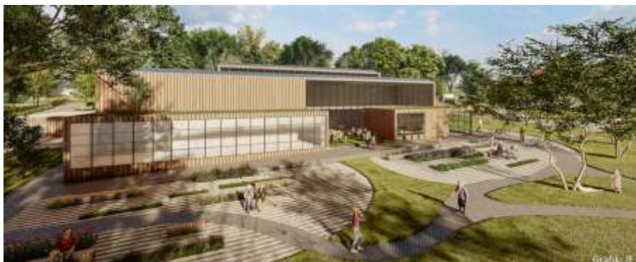
Visualisierung Stadthalle: Ansicht von Süden mit saniertem Schwimmbad und neuen Angeboten wie Café-Kiosk und Eltern-Kind-Bereich.

Die Machbarkeitsstudie zeigt drei grundsätzlich mögliche Lösungsansätze für das Objekt Stadthalle und die daraus resultierenden Handlungskonsequenzen. Nach umfangreichen Vorüberlegungen und Diskussionen konzentriert sich nun die Betrachtung auf die Variante „Stadthalle kompakt“. Dies bedeutet ein bestandsorientierter Umbau und Sanierung des gesamten Gebäudekomplexes. Vorausgegangen war eine Bewertung des Planfalls