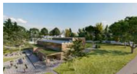
Blick von Süd-Osten auf die sanierte Stadthalle

INFO: Die Machbarkeitsstudie wird durch das Bayerische Städtebauförderprogramm – Sonderfonds Innenstädte beleben – gefördert. Dabei profitiert die Stadt Gefrees von einem erhöhten Finanzierungsanteil und erwartet 90 Prozent an Zuschüssen.