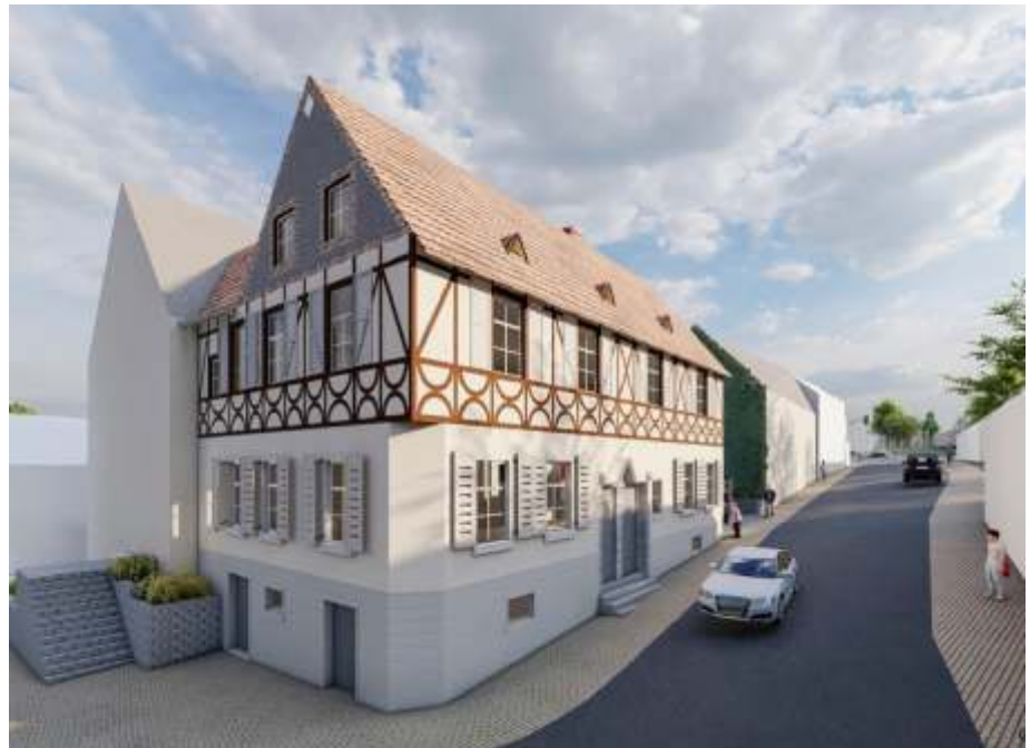
Visualisierung Hofer Str. 1 (vorderer Hausteil) und Hofer Str. 3 (hinterer, nördlicherer Hausteil)

Mit der Bevorzugung der Variante 3 („Haus