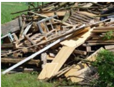
So bitte nicht! Das Verbrennen von Abfällen ist verboten.

Bei der Sammlung von Materialien für das Feuer ist die Versuchung groß, behandeltes Holz und behandelte Holzabfälle (z.B. Böden, Fensterrahmen, Furniermöbelteile, Holzzäune, Spanplatten und Paletten) sowie andere Abfälle (z.B. Dämmstoffe, Reifen, Plastiksäcke und -folien) zur Feuerstelle zu bringen. Daher muss der Veranstalter darauf achten, dass nur unbehandeltes Holz (z.B. direkt aus dem Wald bzw. Abschnittholz aus dem Sägewerk) eingesammelt und verbrannt wird.