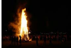
Sonnwendfeuer dienen der Brauchtumpflege und Geselligkeit und nicht der Abfallentsorgung

Leider werden Sonnwendfeuer gelegentlich auch zur Abfallbeseitigung genutzt. So wurden in den vergangenen Jahren beispielsweise lackiertes bzw. imprägniertes Holz, Autoreifen und Möbelteile verbrannt. Durch das Verbrennen dieser Abfälle entstehen gesundheitsschädliche und gefährliche Stoffe. Die Teilnehmer dieser Feste, darunter natürlich auch Kinder, müssen diese Schadstoffe dann einatmen.