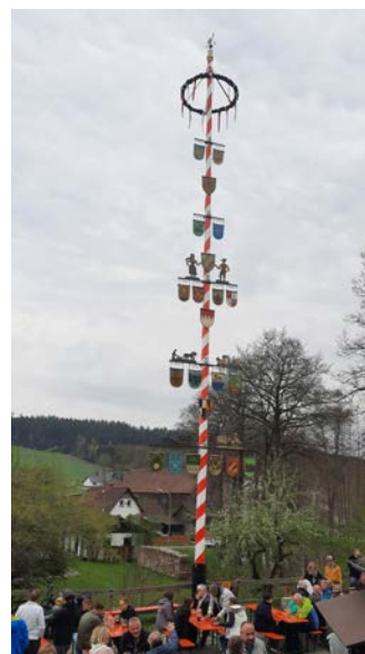
Im Gefreeseer Ortsteil Metzlersreuth steht wieder ein stattlicher Maibaum.