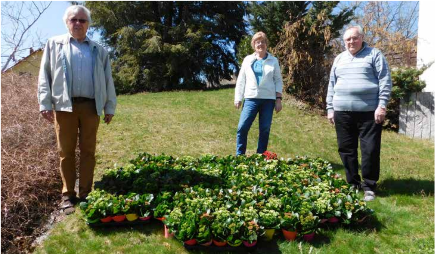
Unser Bild zeigt die 170 Blumenstöckchen zusammen mit der verantwortlichen Vorstandschaft.

In diesem Jahr jährte sich zum 20. Mal der Brauch innerhalb des Ortsverbandes Gefrees, allen weiblichen Mitgliedern ab dem Alter von 50 Jahren zum Muttertag ein Blumenstöckchen zu schenken.