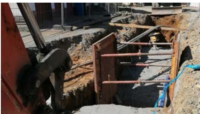
Im Zeitplan liegen die Bauarbeiten für die Kanalerneuerung Gefrees Nord. Hier eine Bestandsaufnahme von der Baustellenbesichtigung am 22.04.2021 in der Friedrich-Ebert-Straße.