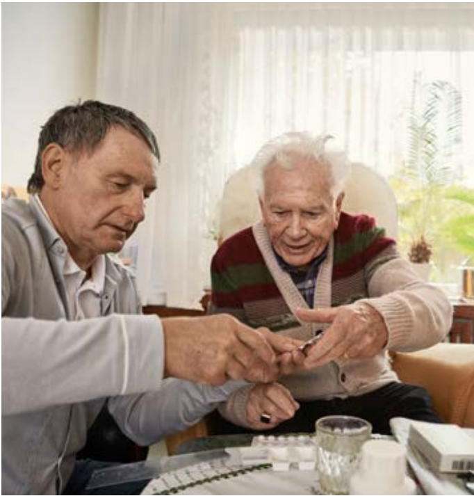
Der neue AOK-Online-Pflegekurs gibt Tipps und Hilfen für den Pflegealltag.

Wer Zuhause einen Angehörigen pflegt, hat meist viele Fragen. Antworten liefert ein neuer AOK-Online-Kurs, der besonders pflegende Angehörige unterstützen soll. Unabhängig von Zeit und Ort ist es damit möglich, sich Kenntnisse anzueignen, die den Pflegealltag erleichtern können.