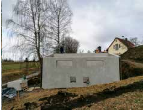
Stein-FW Haus Pumpwerk Hinter dem Feuerwehrhaus in Stein entsteht Pumpwerk 2