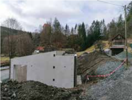
Stein-Pumpwerk 1 Pumpwerk Nummer eins steht am tiefsten Punkt von Stein, nämlich beim Anwesen Galster.