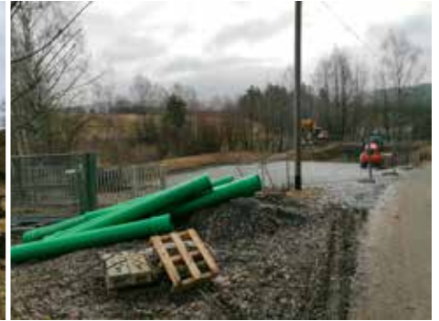
Lützenreuth Pumpwerk Auf dem Gelände der Kläranlage in Lützenreuth laufen die Vorbereitungen für die Erstellung des dritten Pumpwerkes.

Die Ortsteile Stein und Lützenreuth werden an die zentrale Kläranlage in Gefrees angeschlossen. Die ca. 5,5 km lange Verbundleitung wurde bereits im letzten Jahr verlegt. Damit die ca. 100 Meter Höhenunterschied überbrückt werden können, sind drei Pumpwerke notwendig. Zwei entstehen bei Stein, ein Drittes auf dem Gelände der Kläranlage in Lützenreuth. Neben den Pumpwerken müssen auch Drosselschächte, Kanalschächte und Re-