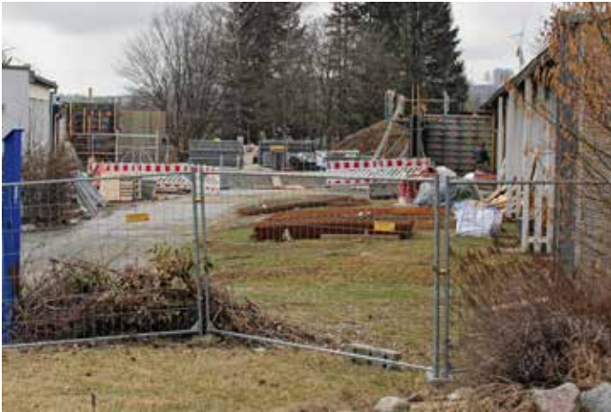
Dank vieler Investitionen, im Bild der Umbau der früheren Mittelschule, hat Gefrees einen Rekordhaushalt beschlossen.

Einen Rekordhaushalt verabschiedete der Stadtrat Gefrees. Allerdings dem geschuldet, dass in Pflichtaufgaben, wie Kanal, Kita, Schule investiert werden muss und einige Vorhaben in das neue Jahr verschoben werden mussten.