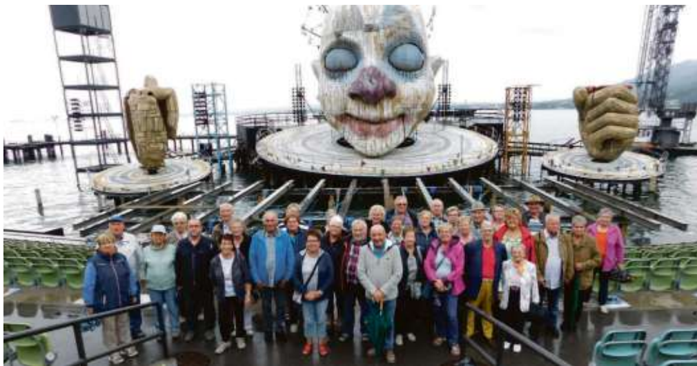
Das Gruppenbild entstand vor der Seebühne in Bregenz.