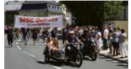
Gefrees-Wiesenfest MSC Gefrees: Ein Bild seines sportlichen Angebots stellt der MSC Gefrees im Festzug vor.