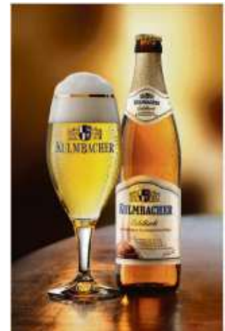
Ein Pilsner 0,5l kostet 3,50 Euro

Sicher zum Wiesentfest und sicher wieder nach Hause Taxi Bobyk: 09273/6857 oder 0700676789000