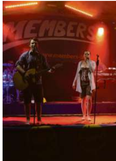
Gefrees-Wiesenfest Members: Die Band „Members“ sorgt am Samstagabend für beste Unterhaltung.

Also stehen fünf Tage ausgelassenem Feiern nichts im Wege. Natürlich bereichert ein moderner Vergnügungspark auf dem Festplatz das traditionelle Fest und auch das reichhaltige Versorgungsangebot lässt keine Wünsche offen. Zudem können sich die Wiesenfestbesucher wieder auf bekannte und beliebte Musikkapellen und Bands freuen. Die getroffene Auswahl an musikalischen Klangkörpern dürfte für Begeisterung unter den Musikfans sorgen. Natürlich ist der Eintritt frei. Besonders familienfreundlich sind die günstigen Preise für nichtalkoholische Getränke im Bierzelt mit 1,50 Euro! tth