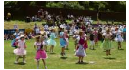
Gefrees-Wiesenfest Spiele der Kinder: Der Wiesenfestmontag gehört den Schulkindern. Dann zeigen diese ihre eingeübten Tänze auf dem Sportplatz.