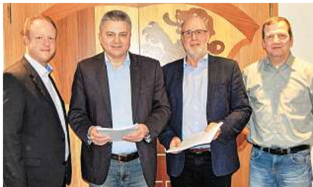
Bürgermeister Harald Schlegel (2. von rechts) hat den Vertrag mit der Telekom unterzeichnet. Der Telefonriese wird rund 30 Kilometer Glasfaserkabel verlegen.

Die Telekom steigt einer Mitteilung zufolge nun in die Feinplanung ein. Parallel dazu werden eine Tiefbau-Firma ausgewählt,