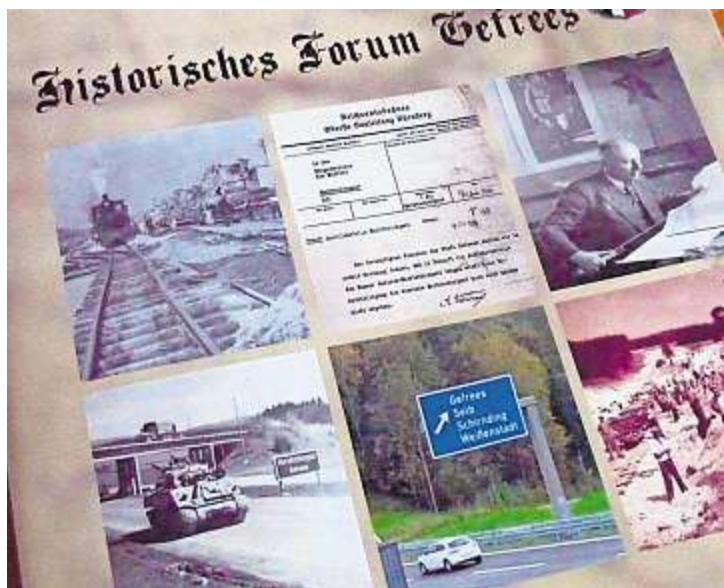
Das neue Heft des Historischen Forums befasst sich mit der heutigen Autobahn 9.

Das Historische Forum Gefrees will sich ab sofort regelmäßiger austauschen und zusammenkommen: Künftig soll es einen festen monatlichen Termin geben, und zwar stets am dritten Donnerstag im Monat um 18 Uhr. Die Örtlichkeit wird wahrscheinlich wechseln, das nächste Treffen ist am Donnerstag, dem 19. Juli, um 18 Uhr im Gasthaus Jahreis in Metzlersreuth.