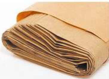
Biomüllbeutel aus Papier

Als Alternative zur Sammlung von Bioabfällen im Haushalt stehen im Handel erhältliche Papierbeutel zur Verfügung, die problemlos mit in die Biotonne gegeben werden können. Man kann die Bioabfälle ebenso in Küchenkrepp oder Zeitungspapier einwickeln. Zum Schutz vor Feuchtigkeit können auch Plastikbeutel verwendet werden, wenn diese nach der Entleerung des Inhalts in die Biotonne separat mit dem Restmüll entsorgt werden.