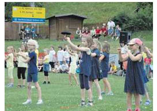
Am Montagnachmittag führen die Schulkinder auf dem Sportplatz die Tänze und Spiele auf.

Am Freitag um 19 Uhr hat Bürgermeister Harald Schlegel Schwerstarbeit zu verrichten: der Bieranstich steht an. Mal sehen, wie viele Schläge das Stadtoberhaupt benötigt oder ob's ein spritziges Vergnügen wird? Danach regiert auf der Bühne die Party- und Gala-Band „Joe Williams“. Mit Musik der 70er-, 80er- und 90er-Jahre sowie den aktuellen Hits aus den Rock/Pop und Dance Charts sorgen sie für eine ausgelassene Partystimmung. Um 22.15 Uhr steigt das große Brillantfeuerwerk.