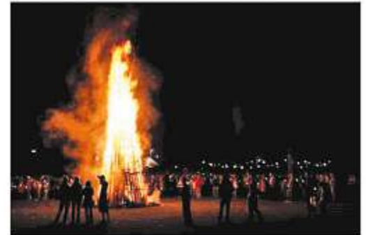
Sommwendfeuer dienen der Brauchtumpflege und Geselligkeit und nicht der Abfallentsorgung

Leider werden Sommwendfeuer gelegentlich auch zur Abfallbeseitigung genutzt. So wurden in den vergangenen Jahren beispielsweise lackiertes bzw. imprägniertes Holz, Autoreifen und Möbelteile verbrannt. Durch das Verbrennen dieser Abfälle entstehen gesundheitsschädliche und gefährliche Stoffe. Die Teilnehmer dieser Feste, darunter natürlich auch Kinder, müssen diese Schadstoffe dann einatmen.