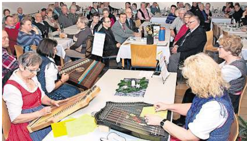
Unter anderem die Gruppe „Saitenklang“ gestaltete die Jubiläumsfeier „70 Jahre VdK Gefrees“.