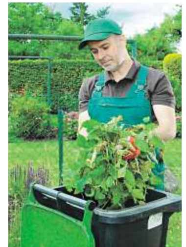
Biotonne im Sommer

Sollten sich dennoch in der Biotonne Maden entwickeln, vernichtet eine kräftige Dosis Branntkalk das Ungeziefer (Anwendungshinweise beachten, Verätzungsgefahr!). Alle genannten Hilfsmittel gibt es im Baumarkt, im Baustoffhandel oder im Gartencenter.