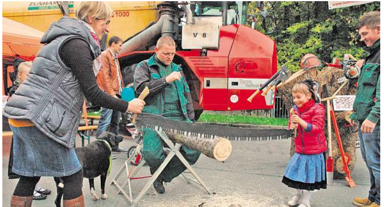
Das örtliche Handwerk nutzte die Schau auch für die dringend notwendige Nachwuchswerbung. Auch wenn das für diese kleine Besucherin sicherlich noch etwas zu früh kommt.