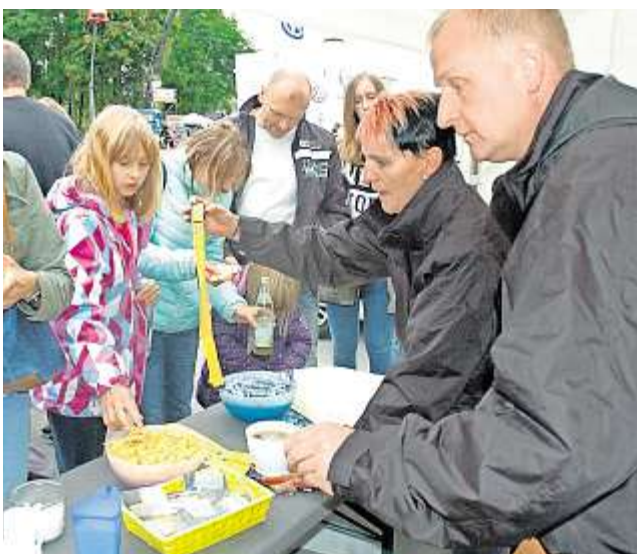
Auch in kulinarischer Hinsicht verstanden es die Veranstalter, ihr Publikum zu verwöhnen.

Näheres wollen die Aussteller diskutieren, wenn sie bei einem Treffen Bilanz zum ersten Gewerbemarkt ziehen.