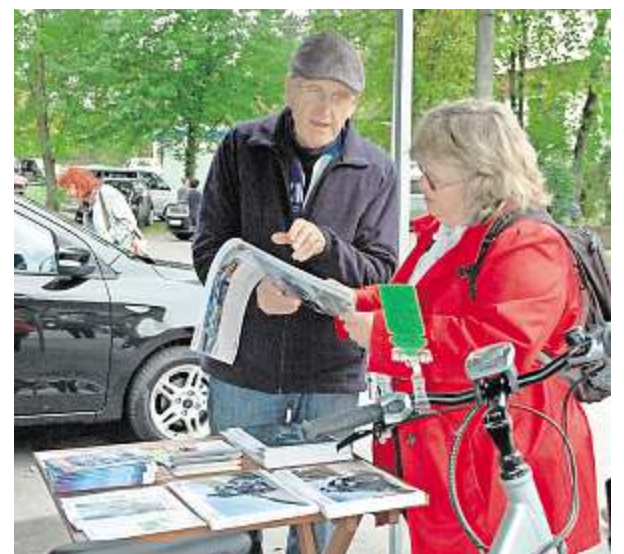
Zahlreiche Geschäfte präsentierten beim Gewerbemarkt das breite Spektrum an Waren und Dienstleistungen.