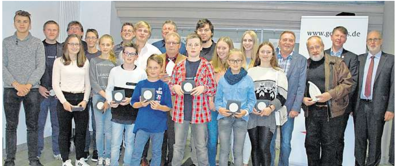
Ehrenamtliche und Aushängeschilder des Sports erfuhren durch Bürgermeister Harald Schlegel wieder eine besondere Ehrung.

Beim ersten Ehrenabend im vergangenen Jahr waren es 18 Männer und Frauen, deren besondere Verdienste gewürdigt wurden. Heuer hatten die Vereine und Einzelpersonen vier weitere Langstreckenläufer des Ehrenamtes für die Auszeichnung vorgeschlagen. Die Veranstaltung wurde jetzt mit der traditionellen Sportlerlehrung verknüpft.