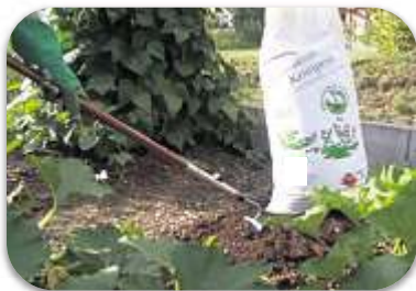
Anwendung / Zurück in die Natur