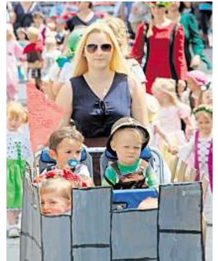
Die Knirpse der evangelischen Kindertagesstätte „Pfiffikus“ führten den Festzug mit an.

Das Gefreeseer Wiesenfest 2016 ist Geschichte. Tag vier hat mit dem Umzug durch die Stadt den absoluten Höhepunkt gebracht. Bei strahlendem Sonnenschein marschierten 1500 Teilnehmer aus über 30 Vereinen. Einmal mehr mit Leben erfüllt war die von Bürgermeister Harald Schlegel ausgegebene Losung: „Jeder, der in Gefrees Wurzeln hat, kommt zum Wiesenfest.“ Der fünfte Tag stand wieder ganz