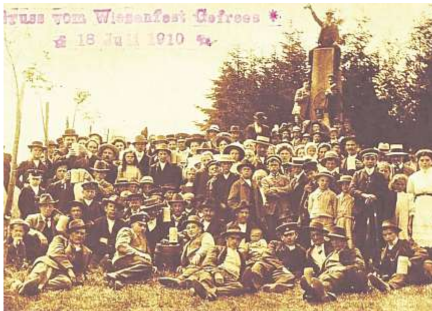
Das Luitpolddenkmal in Gefrees beim Wiesenfest 1910. Und immer schaffte es jemand, auf das Denkmal zu steigen.

Und schon damals wurden immer mehr Ehescheidungen beklagt. Die Schuldigen waren ausgemacht: die Eltern, weil sie ihre Töchter nicht richtig erziehen. Dazu war in der Zeitung zu lesen: „Kaum haben die jungen Mädchen der Schule den Rücken gekehrt, so ist ihr Sinn und Trachten darauf gerichtet, an den Vergnügungen und Zerstreuungen teilzunehmen. Dadurch erhalten sie