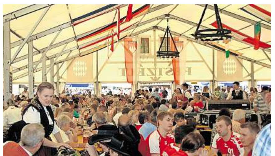
Nicht nur draußen, wo es natürlich an den Sommerabenden am schönsten war, sind heuer beim Wiesenfest wieder alle Plätze besetzt gewesen, sondern auch im großen Festzelt.