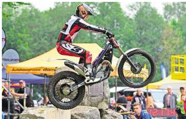
Spektakuläre Aktionen wurden den Zuschauern geboten.

TV, der Feuerwehr und dem Roten Kreuz zu sehen.