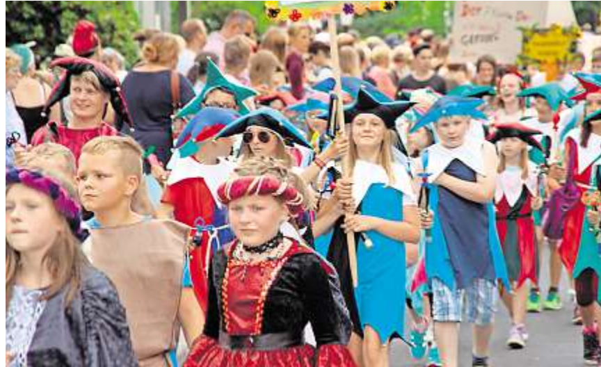
Historisch gekleidet marschierten die Mädchen und Jungen sowie die Lehrkräfte der Grundschule durch die Stadt. Dagegen zeigten die größeren Schüler auf Plakaten Argumente auf, wieso Gefrees so lebens- und liebenswert ist. .