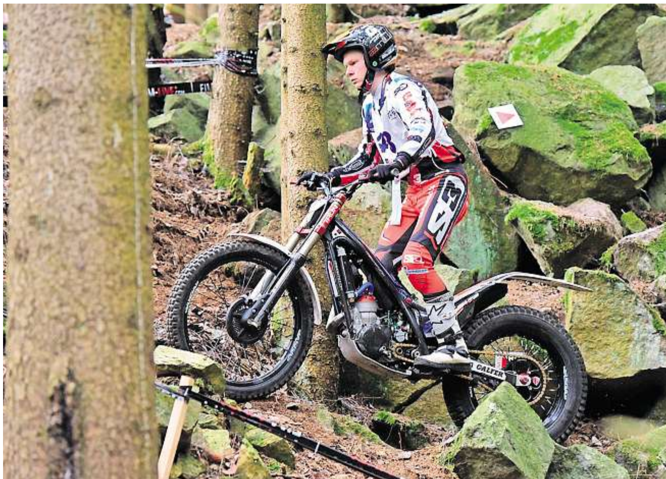
Auf die Cracks der Trial-Szene warteten in Gefrees sehr anspruchsvolle Sektionen.

An den zwölf Sektionen auf dem Sportgelände und auf der ganzen Strecke: Überall waren die zahlreichen freiwilligen Helfer vom MSC, dem Skiclub, dem Tennisclub, vom