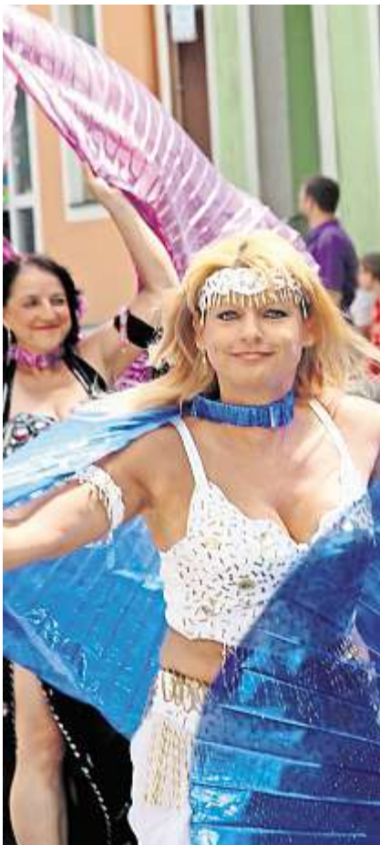
Für eine exotische Note sorgten im Festzug attraktive orientalische Tänzerinnen.