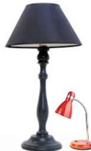
Steh- und Tischleuchte

Leuchten hingegen sind die „Vorrichtungen“, die mittels einer Lampe zur Beleuchtung dienen. Diese gibt es in vielen verschiedenen Arten, wie Decken-, Steh-, Wand- und Tischleuchten usw.