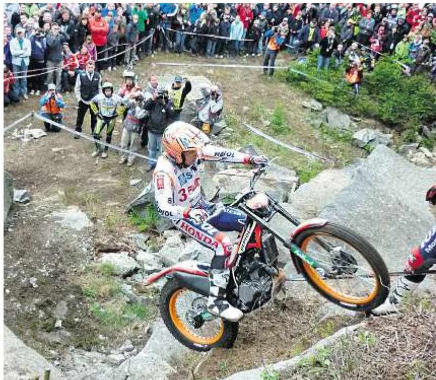
Die Freunde des Motorsports erwarten bei der WM wieder viele Stars der Trial-Szene und spannende Wettkämpfe.

Die führende Nation ist seit den letzten globalen Meisterschaftsläufen von Gefrees nach wie vor Spanien. Nach der Erfolge in den Jahren 1989 und 1993 durch Trial-Legende Jordi Tarres, der den Trial-Fahrstil revolutionierte, waren es in den Jahren 2005 und 2011 erneut Spanier, die in Gefrees gewinnen konnten. Vor allem der neunfache Weltmeister Antonio „Toni“ Bou und der zweifache Gefrees-Sieger