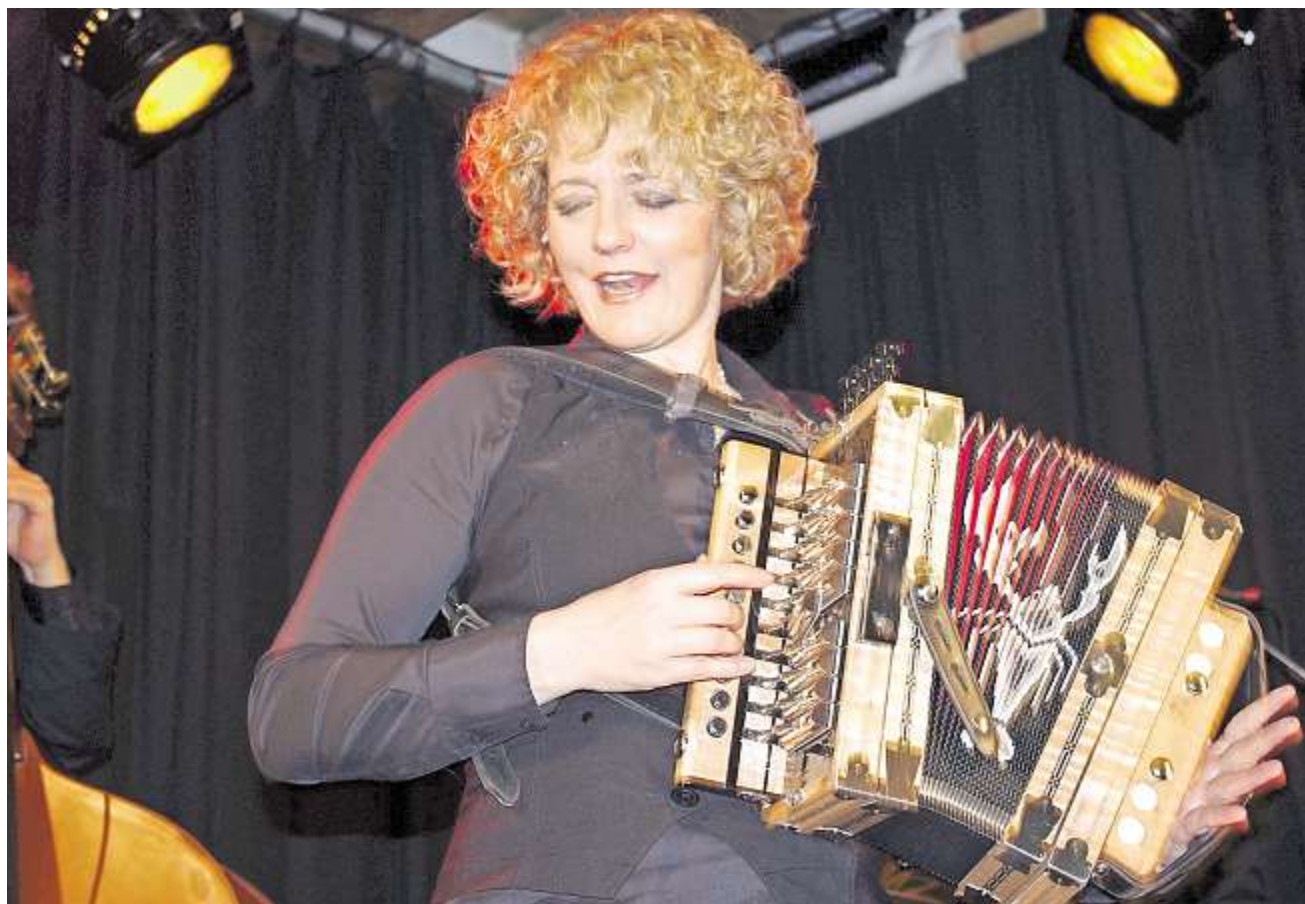
Annie Zydeco kommt am 9. April nach Gefrees.

● Jazzfreunde kommen am Sonntag, 24. Juli, um 11 Uhr beim musikalischen Frühschoppen mit den beliebten Bay-