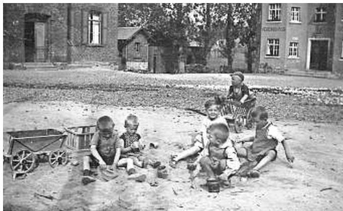
Dieses historische Foto zeigt Angerkinder beim Spielen vor dem Vereinshaus im Jahr 1934.