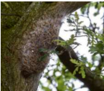
Nest des Eichenprozessionsspinners