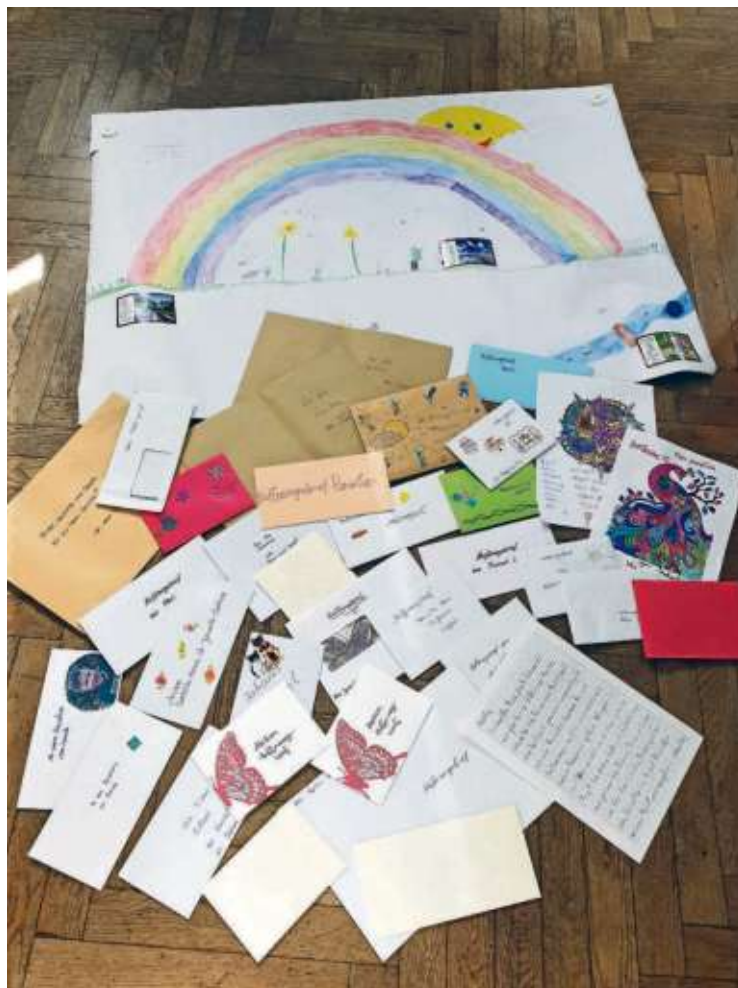
Liebevoll hatten die Grundschüler ganz viele „Hoffungsbriefe“ gestaltet.