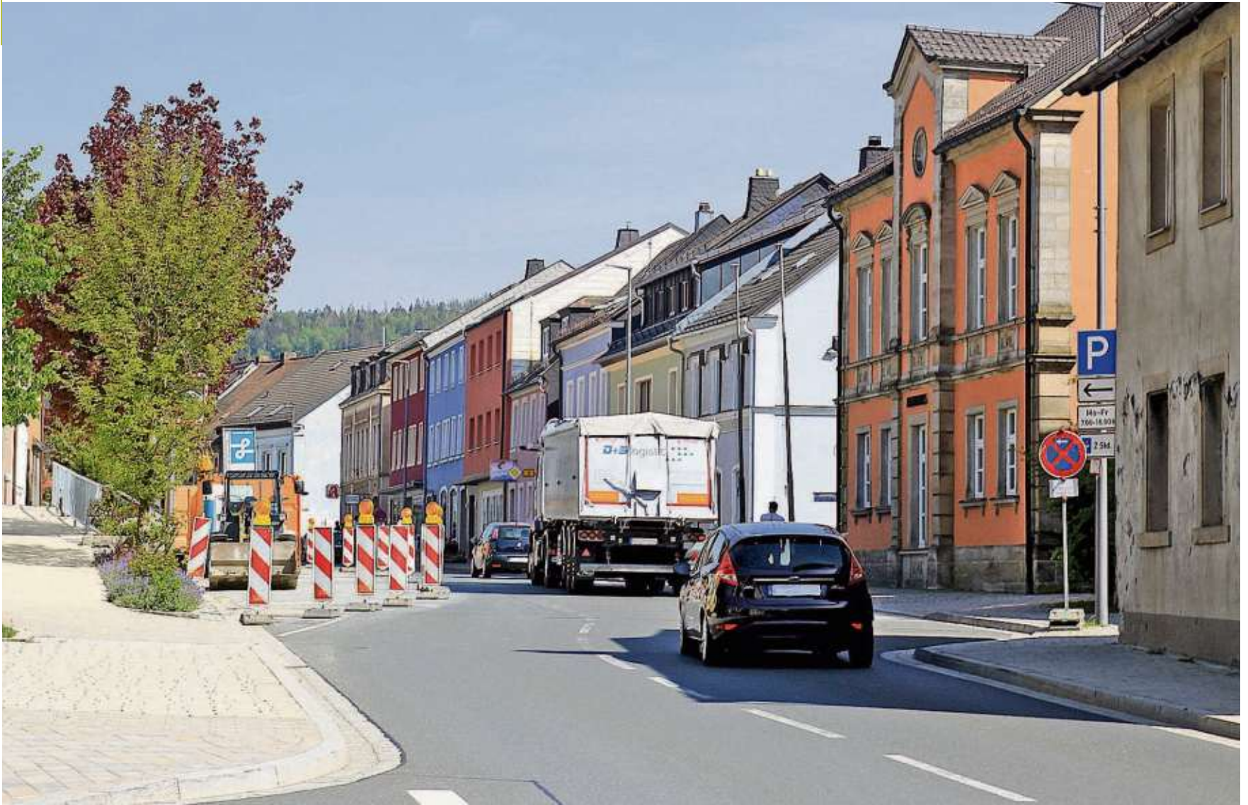
An der Baustelle ist die Ortsdurchfahrt verengt.