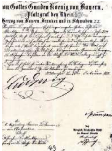
Brief von König Ludwig II. vom 26. Februar 1880 zur Stadtrechtsverleihung.