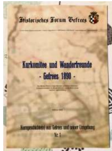
Die neue Arbeit des Historischen Forums über Gefrees im Jahr 1890, veröffentlicht für Mitglieder des Vereins.