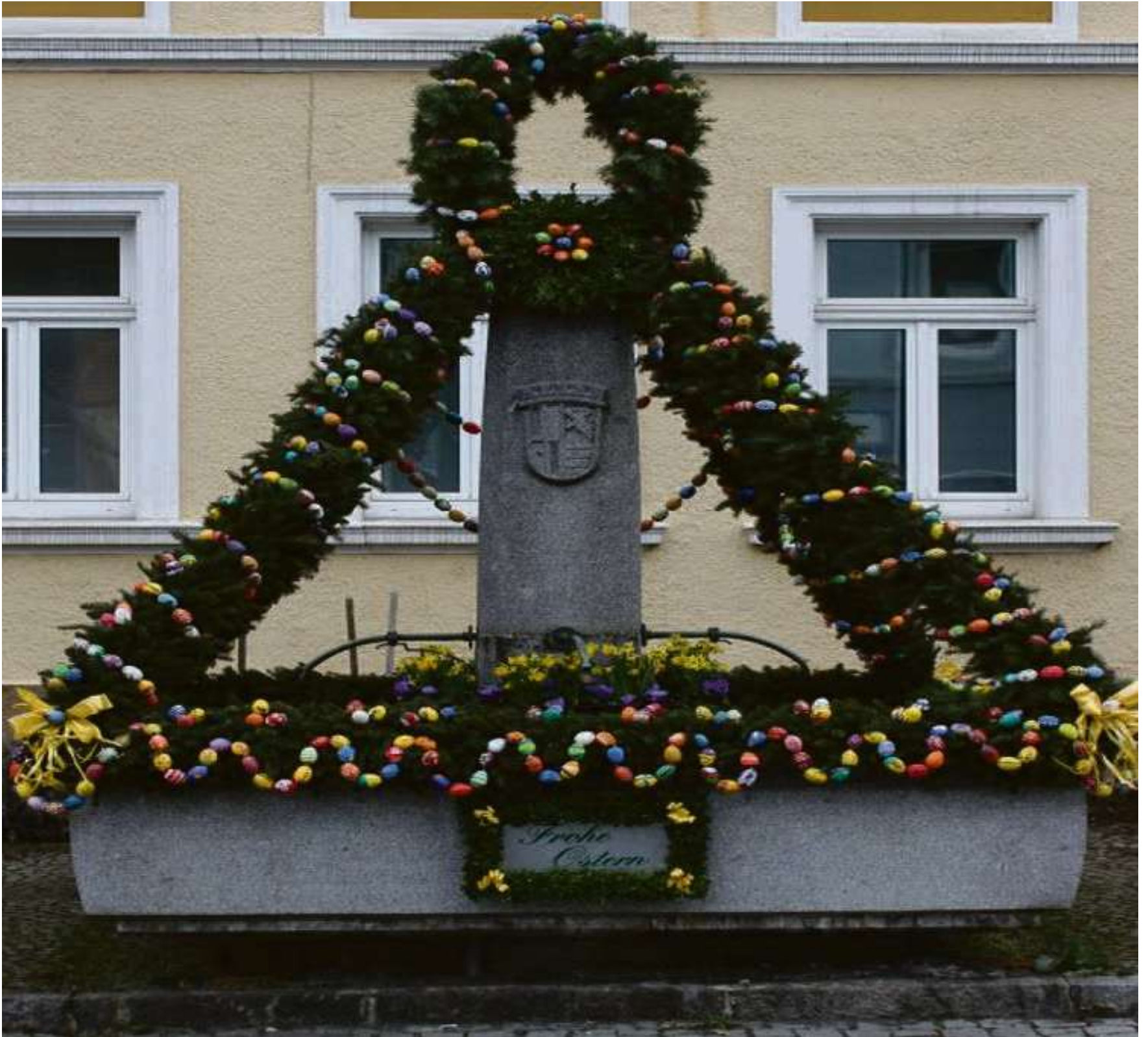
Blick auf den Osterbrunnen von Gefrees.