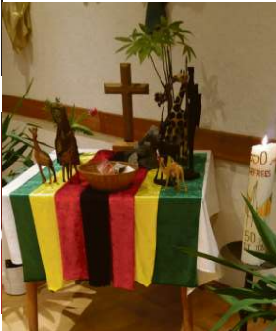
Das Foto zeigt den Altar.

Unter dem Motto „Steh auf und geh!“ feierten am Freitag, 6. März, ab 19 Uhr im Pfarrsaal St. Josef etwa 30 Frauen zusammen mit dem ökumenischen Vorbereitungsteam die Andacht zum Weltgebetstag. Damit reihten sie sich ein in die Gebetskette rund um den Erdball, die jedes Jahr am ersten Freitag im März gebildet wird. Probleme und Hoffnungen der Frauen in Simbabwe wurden in zwei kleinen Anspielen, einer Bildmeditation, Gebeten und Bibeltexten verdeutlicht. Gemeinsam gesungene Lieder mit Ohrwurmpotential rundeten die eindrückliche Andacht ab. Anschließend feierten alle Frauen im familiären Kreis rund um eine große Tafel ein gemeinsames Mahl mit Köstlichkeiten aus der Küche Simbawwes. Ike Heinz/esh