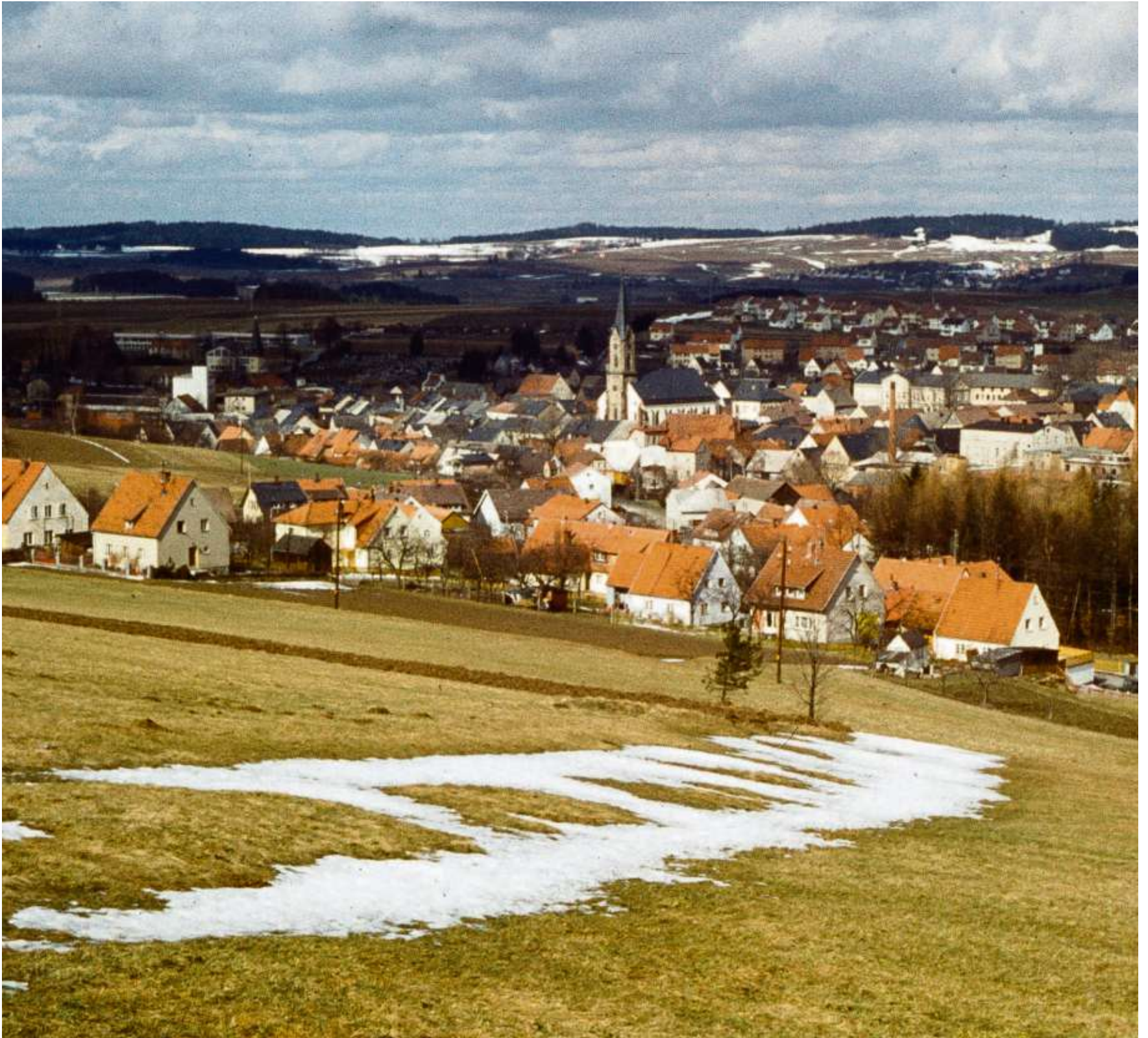
Blick auf Gefrees in den 1960er-Jahren. Das Foto wurde vom Historischen Forum zur Verfügung gestellt. Herzlichen Dank.