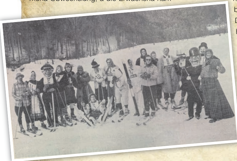
Februar 1953: Skiclubfasching auf der Langwiese. Besonders die Sportler machten Gefrees in den Jahren nach dem Krieg zu einer Faschingshochburg.

Des worn noch Zeidn! A die draditionelle „Maskierde Durnschdund“ wor immer a Erlebnis. Schbeder senn die Feiern in die Schdoddhall verlegd worn, doch des Fler vom „Aldn Vereinshaus“ wor unerreichd. Obber mid der Zeid senn die Veranschaldungen immer wenger worn, wall sich in die Vereine immer mehr Undädigkeit eigschlichn hod und a die Bevölkerung, durch die Berieslung vo Funk und Fernseh immer bequemer worn is. Der Gfreiser Fasching is zern grussn Daal mid der „Ölschnitz“ noch Berneck gflaid worn und drebd edzd dard seina Schbässla.