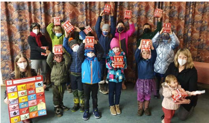
Stolz halten die Kinder ihre Geschenke in die Höhe: Wer den Lösungssatz des Adventskalenders herausfand, bekam die neue Tasse der Volkstanzgruppe als Geschenk.

„Ein Nachweihnachtsgeschenk“ durften sich die Kinder der Trachten- und Volkstanzgruppe Gefrees von ihren Jugendleitern abholen: Der „Nikolaus“ hatte ihnen einen Adventskalender gebracht, den die Jugendleiter selbst erstellt hatten, mit 24 kleinen Briefchen mit Wissenswertem rund um Advent und Weihnachten: Bildchen zum Ausmalen, kurze Geschichten, Rätsel, Puzzle, ein Rezept für Plätzchen und vieles mehr. Jeden Tag musste ein Buchstabe gesucht werden, was zu einem Lösungssatz führte. Wer diesen Satz an die Volkstanzgruppe meldete, bekam nun ein Geschenk: die neue Tasse der Volkstanzgruppe, die heuer 40. Bestehen feiert; die Kinder bekamen als Erste diese Tassen.