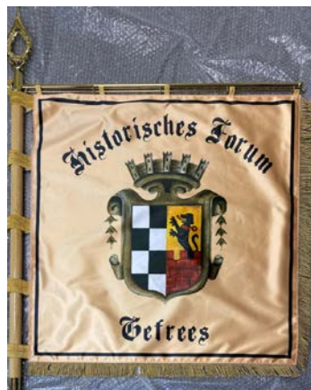
Die neu angeschaffte Fahne, für die 2023 eine Fahnenweihe geplant ist

Außerdem wird das Historische Forum dieses Jahr erstmals beim sonntägigen Wiesenfestzug mitmarschieren. Hierfür wurde sogar eigens eine Vereinsfahne angeschafft. Für diese Fahne will das Forum auch, ganz in alter Tradition, eine Fahnenweihe durchführen. Für diesen Festakt laufen die Vorbereitungen bereits.