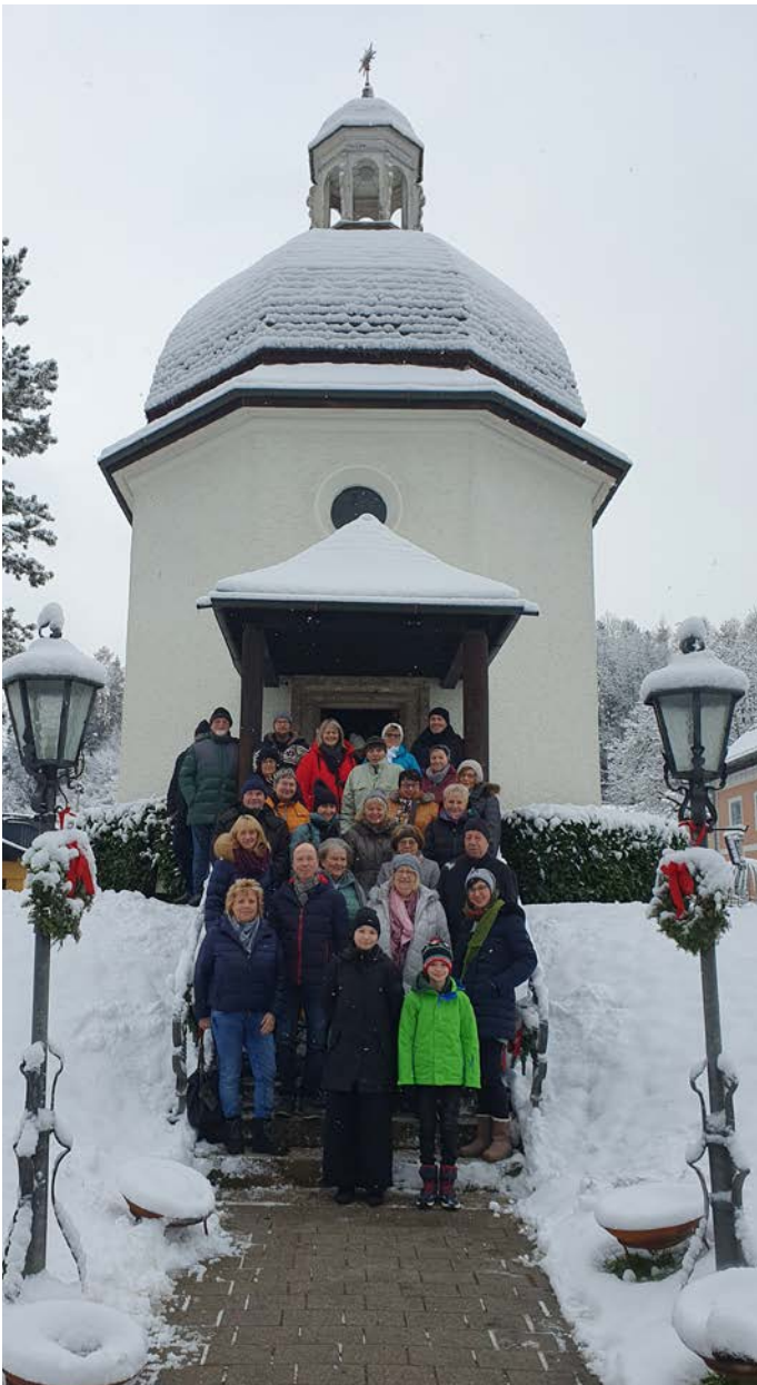
Ein Teil der Gruppe vor der Stille Nacht Kapelle in Oberndorf.