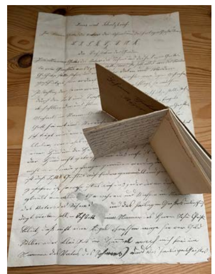
Die zwei Schutzbriefe aus dem Archiv des Historischen Forums

Der Verein ist noch im Besitz eines vierseitigen aus Gefrees stammenden Haus- und Schutzbriefes, der ebenfalls aus dieser Zeit stammt. Er sollte das Haus vor Feuer, Wasser und Krieg schützen und den Hausbesitzer gleichzeitig auch vor Hunger, Krankheit und anderem Unheil. Aus heutiger Sicht mögen solche Zettel und Heftchen eher amüsant wirken oder gar Kopfschütteln hervorrufen. Doch einst waren sie weit verbreitet und aus damaliger Sicht auch wirkungsvoll. 150 Jahre später sind sie kleine kulturhistorische Kostbarkeiten.