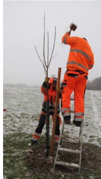
Die Gemeindemitarbeiter Sigrid Schnappauf und Daniel Trautner bei der Obstbaumpflanzung in Haag. Die beste Pflanzzeit für Obstbäume ist der Zeitraum von Ende Oktober bis März. Wichtig ist dabei, dass der Boden frostfrei ist.

Die Obstbäume bestellten die Landschaftspflegeverbände bei einer fränkischen Baumschule. Die Eigentümer sorgten für die fachgerechte Pflanzung und sichern die zukünftige Pflege und Betreuung. Die Aktion wurde von allen Seiten mit Begeisterung angenommen und umgesetzt. Damit soll zum einen der Überalterung von Streuobstbeständen im Landkreis durch die Nachpflanzung von Jungbäumen entgegengewirkt werden. Zum anderen sollen die oft inselartig verstreuten Obstwiesen durch die Anlage weg begleitender Obstreihen besser miteinander vernetzt werden. Und schließlich soll die Lust auf den einzigartigen und schützenswerten Lebensraum Streuobstwiese und dessen gesunden und leckeren Früchten geweckt werden.