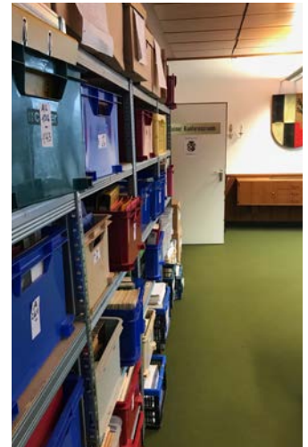
Am Tag der Schlüsselübergabe wurden bereits erste Archivbestände eingeräumt.

Zu gegebener Zeit im Frühjahr wird das Historische Forum einen Tag der offenen Tür veranstalten. Alle Interessierten können dann das Archiv näher betrachten und hinter die Kulissen der erfolgreichen Vereinsarbeit blicken.