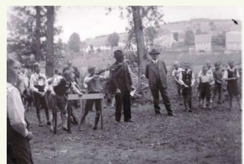
1937 Armbrustschießen beim Wiesenfest