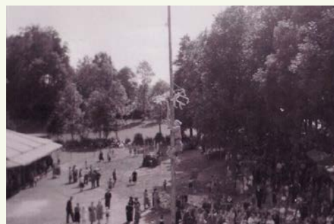
Ehemaliger Festplatz an der Stelle der heutigen Stadthalle mit Kletterbaum