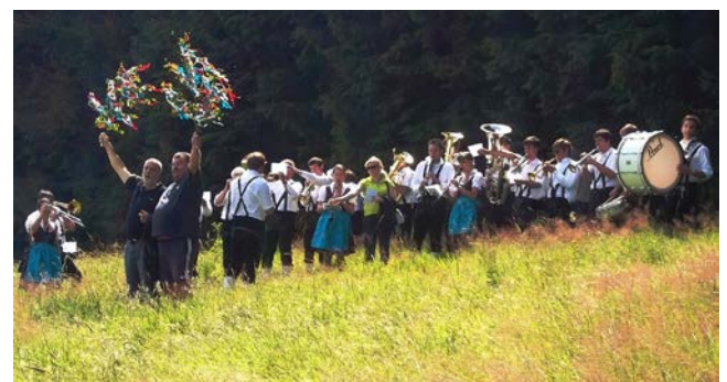
Wiesenfestmontag: Nach dem Frühschoppen am Denkmal geht es mit Zwischenhalt mit Einlage der Musik zurück zum Festplatz.