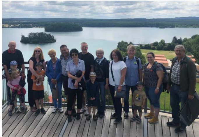
Ein Teil der Gefreeseer Reisegruppe nach dem Erklimmen der obersten Aussichtsplattform der Erlebnisholzkuugel am Steinberger See

Nach zwei Jahren Corona Zwangspause war es nun endlich wieder soweit. Der mittlerweile fast schon traditionelle Familienausflug des Gefreeseer Jugendleiterstammtisches durfte stattfinden. Die Oberpfalz mit ihren Sehenswürdigkeiten war dieses Mal das Ziel des Busses, dessen Kosten freundlicherweise erneut von der Stadt Gefrees übernommen wurden.