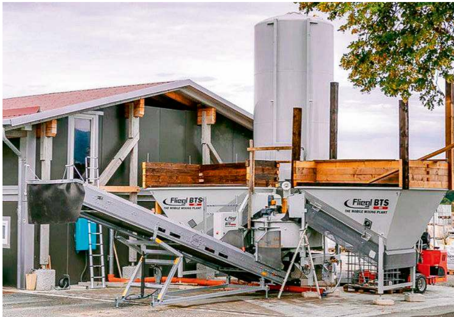
Die Betontankstelle der Firma Tröger Natursteine in Streitau.

etwas. Eine Firma will man aber nicht beauftragen, zum Baumarkt ist es zu weit oder man hat keine Zeit, sich um die richtige Mischung des Betons zu kümmern.