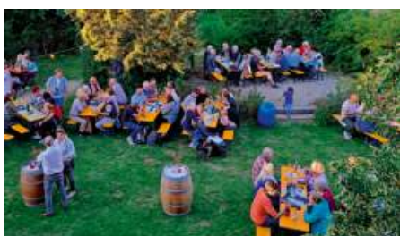
Großen Anklang fand das Weinfest der CSU Gefrees im Garten des Künneth'schen Palais.

Nach mehrjähriger Pause führte die Gefreeseer CSU wieder ihr beliebtes Weinfest auf dem Areal des Künneth'schen Palais