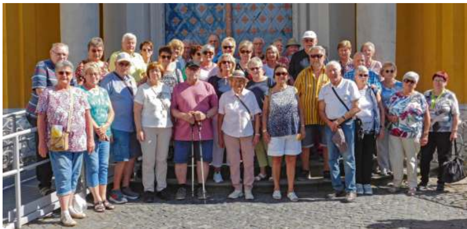
Fünf schöne Tage mit einem abwechslungsreichem Programm erlebte die Reisegruppe des VdK-Ortsverbands Gefrees im Spreewald.

Es waren wunderschöne fünf Tage mit herrlichem Wetter und wunderschöner Natur.