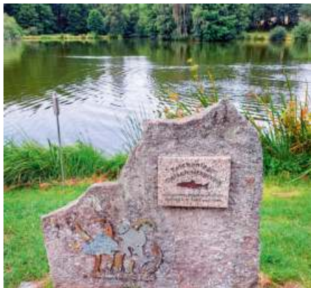
An der Teichanlage Ölschnitzgrund bei Bechertshöfen fand das Teichfest des Angelsportvereins Gefrees statt.