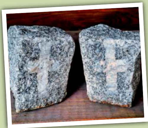
Zwei sogenannte „Hundela“-Granitpflastersteine, geschlagen von Steinhauer Michael Seibel. Die Kreuzmarkierung entstand durch Quarz.