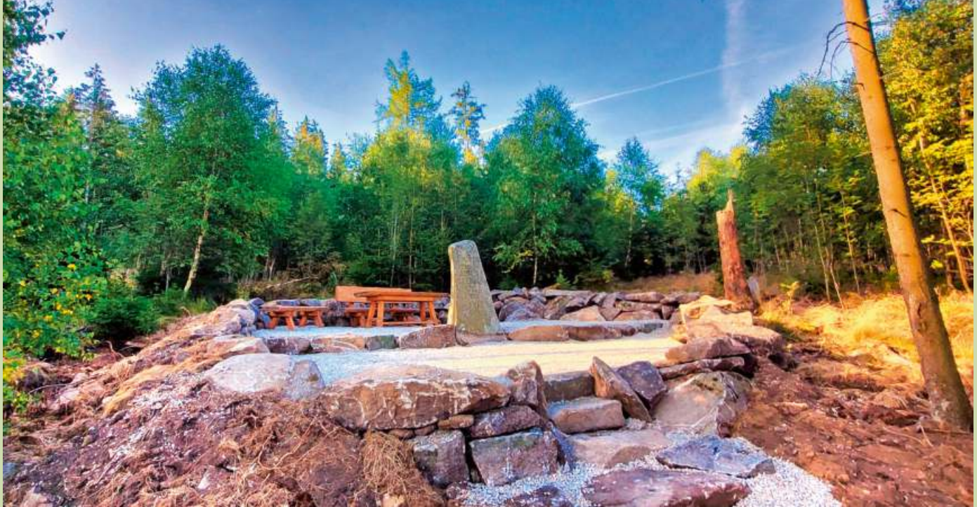
In Zusammenarbeit mit dem Bayerischen Staatsforsten machte der Fichtelgebirgsverein Gefrees das Steinhauerdenkmal auf der Hohen Reuth der Öffentlichkeit wieder zugänglich. Eine Bank lädt jetzt dort zum Verweilen ein, außerdem soll noch eine Infotafel aufgestellt werden.

Die Geschichte der alten Steinhauer von Gefrees geht zurück auf die Zeit der Markgrafen. Es war Markgraf Georg Wilhelm von Brandenburg-Bayreuth, der 1721 die Steinnutzung regelte, denn man wollte den wilden Abbau, insbesondere von Granit, verhindern. Jeder der Granit abbauen wollte, musste ein Bergpatent erwerben, eine Erlaubnis zum Abbau, das Mutungsrecht. Unter bayerischer Herrschaft wurde das Mutungsrecht 1810 vergeben und 1858 beim Bergamt Wunsiedel neu festgelegt. 1990 wurde dieses Bergrecht noch einmal bestätigt.