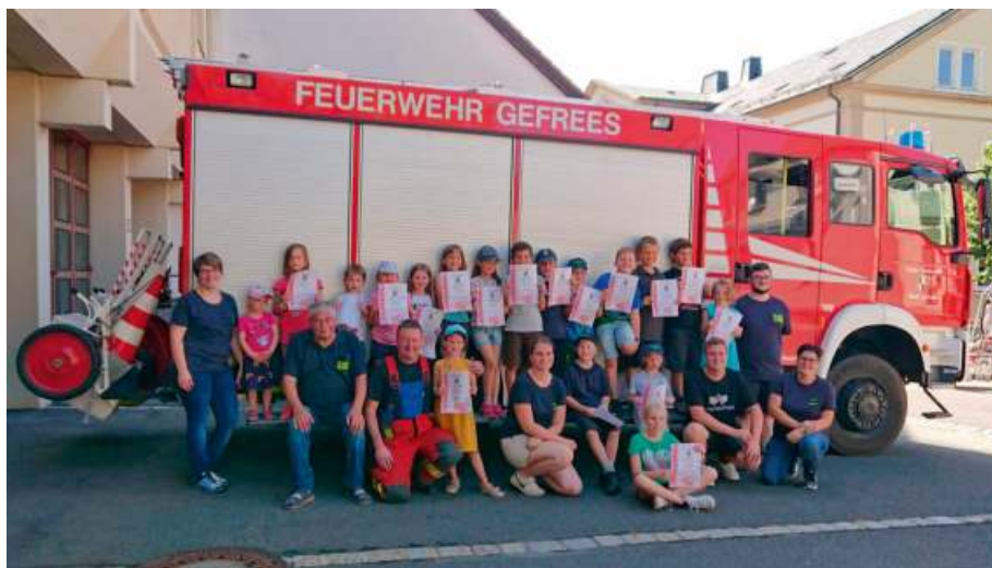
17 Kinder hatten viel Spaß beim Schnupperrnachmittag im Rahmen des Gefreeseer Ferienprogramms bei den Wasserdrachen, der Kinderfeuerwehr Gefrees.