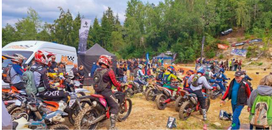
161 Starter gingen in Gefrees an den Start.