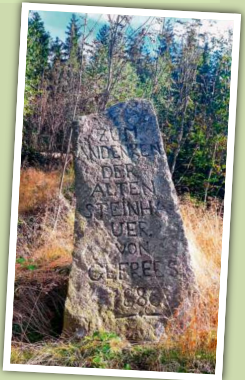
Eingewachsen und verwildert: Das Denkmal auf der Hohen Reuth in den letzten Jahren.