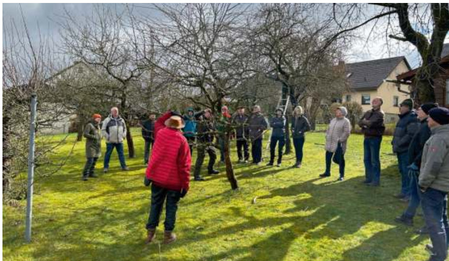
Einen Apfelbaum muss ich anders schneiden als einen Zwetschgenbaum. Diese und weitere Erkenntnisse erlangten die Teilnehmer des Baumschnittkurses.

Das Wetter spielte an diesem Tag zum Glück