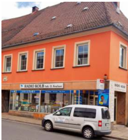
Der Laden in der Hauptstraße 68 in Gefrees