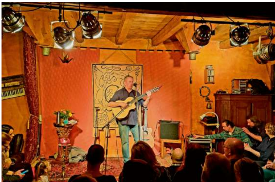
Luka Bloom, der irische Sänger und Songschreiber war zu Gast in der Konzertscheune.