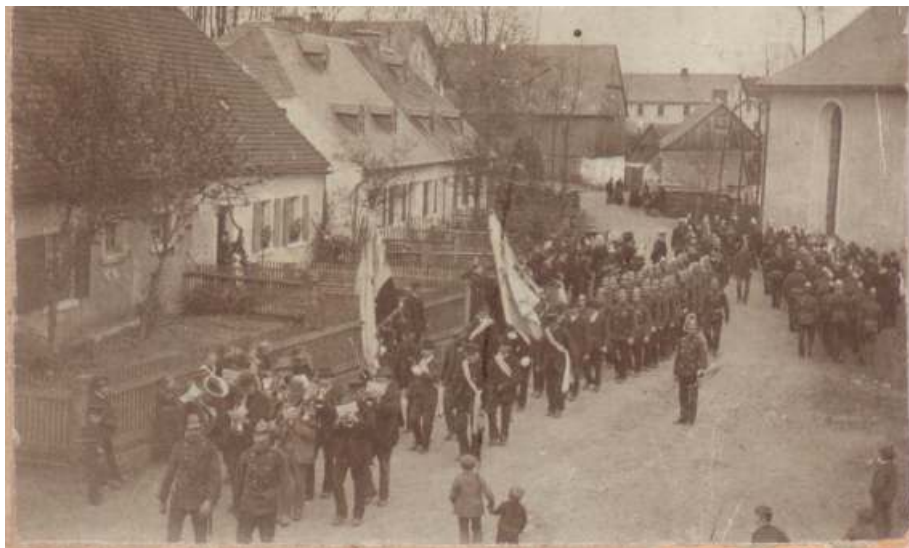
Festzug zum 25-jährigen Bestehen der Freiwilligen Feuerwehr Streitau im Jahr 1899.

Schon immer hat es Männer gegeben, die in nachbarschaftlicher Hilfe bereit waren im Ernstfall eine Kette zu bilden und die mit Wasser gefüllten Eimervon Mann zu Mann bis zur Brandstelle zu reichen (siehe z. B. Verzeichnis des Feuersdienstes um 1852 auf unserer Homepage). So schloss sich auch selten eine Familie vom Feuersdienst aus, denn jeder war darauf bedacht, im Notfall die Hilfe des Nächsten zu erhalten. Man musste aber schließlich einsehen, dass ohne organisierte und eingeübte Brandbekämpfung vor allem bei Großbränden wenig auszurichten war. Um 1872 gab es im königlichen Bezirksamt Münchberg eindeutige Bekanntmachungen, dass die Gemeinden und Dörfer „zur Einrichtung solcher Feuerwehren“ angewiesen sind. Und so kam es, dass vor 150 Jahren auch Streitau eine Freiwillige Feuerwehr gründete.