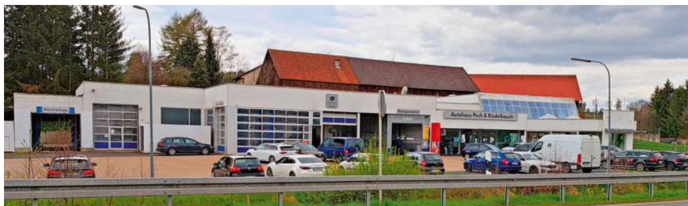
Die Betreiber des Autohauses Pech & Riedelbauch haben Insolvenzantrag gestellt.