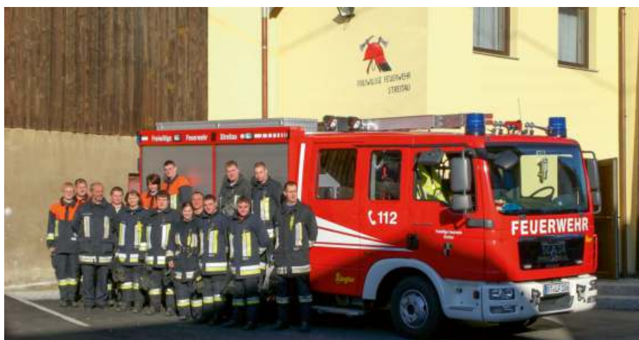
Das Foto entstand 2010 zur Gerätehauseinweihung und Fahrzeugübergabe.

Herzlicher Dank gilt unserem Ehrenvorstand Gerhard Tscheuschner, der die zahlreichen Archive im Umkreis durchforstete und Texte aus altdeutscher Schrift übersetzte, und uns damit einen beeindruckenden Einblick in die Geschichte der Freiwilligen Feuerwehr Streitau gibt. Tanja Günther