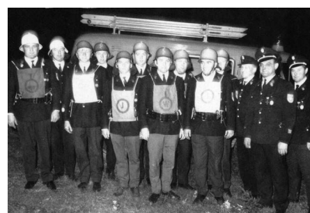
1968: Abnahme der Leistungsprüfung für zwei Gruppen. Als erste Löschgruppe im Landkreis Münchberg wurde das Abzeichen in „Gold“ abgelegt.

Und noch etwas hat über all die Jahre hinweg nichts von seiner Aktualität und seinem inneren Wert verloren. Es ist der Leitspruch, an dem alle