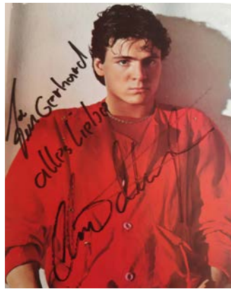
Autogrammkarte des Sängers Nino de Angelo von 1983.

Im Fotoalbum des Hotels Grüner Baum befinden sich auch Bilder der Schauspielerinnen Lise-