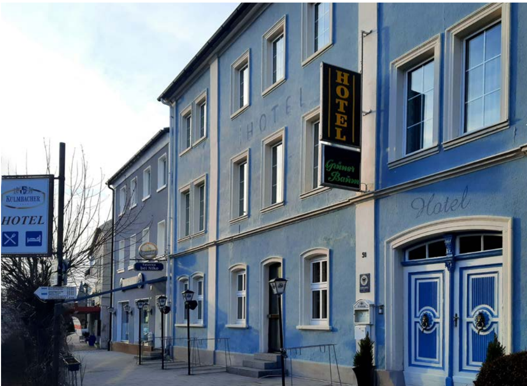
Das Hotel Grüner Baum in der Hauptstraße 51 in Gefrees.