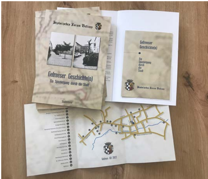
Stadtführer und Faltpplan, frisch aus der Druckerei